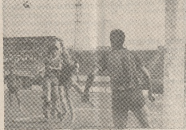
Μια φάση από τον αγώνα Εργοτέλης - Πάτρας (2-0).

ΓΚΟΛ ΑΠΟ ΤΑ ΑΠΟΔΥΤΗΡΙΑ ΣΤΙΣ 5 ακριβώς ο Αθηναίος διαιτητής κ. Λεξός (Μπαλάσκας-Μαρινής) κάλυψε τις ο μύδους στον αγωνιστικό χώρο που παρατάχθηκαν μπροστά του με τις εξής συνθέσεις: ΕΡΓΟΤΕΛΗΣ: Χαλκιάδης, Ροδιτάκης, Κρανιωτάκης, Τουτουτζόγλου, Κανταρτζής, Χατζηπαναγιώτου (65 Κατεργιανός), Γιαλαμάς, Κανάρης, Δούκας (58' Τζαμαίσης), Καρέλλης. ΠΑΤΡΑ: Δελέγκος Ι., Θεοφιλάτος (49' Παναγιώπουλος Π.) Δημητρίου, Ιωαννίδης, Καπελιώτης Γραμματικόπουλος, Δελέγκος Ν., Δημητρίου, Ξένος, Παρασκευάς, Κορκάκης. ΤΟ χρονομέτρο σημάδεψε το 2ο λεπτό όταν ο Εργοτέλης κέρδισε ένα φάουλ, έσω από την περιοχή και σε πένα για τον Ροδιτάκη, που είδε αμάρτυρα στους τούρκους. Τους πέταξε τη μπάλα, με ακρίβεια και ο Λούκας πετάχτηκε και με πλασάρι στο σουτ την έστειλε στα δίχτυα. Ο δρόμος για την πρόκριση του Εργοτέλη είχε ανοίξει. ΣΤΟ 17' ο Γαλατάς, από με ταβίβα, του Κανταρτζή, σουτάρε από το σημείο του πένα, το αλλά ο τερματοφύλακας με εκκολάει έπιασε τη μπάλα. ΚΟΝΤΑ στο δεύτερο γκολ έφτασε ο Εργοτέλης στο 21ο λεπτό, όταν ο Χατζηπαναγιώτου έκανε μπάσσο από θέση έξω δεξιά και σέντραρε, για να «πέσει» κεφαλάκι ο Κανταρτζής και να στείλει τη μπάλα «στουρί» άουτ. ΑΠΟ το 27 μέχρι το 32 έμεινε συνεχώς στη σελ. 5.