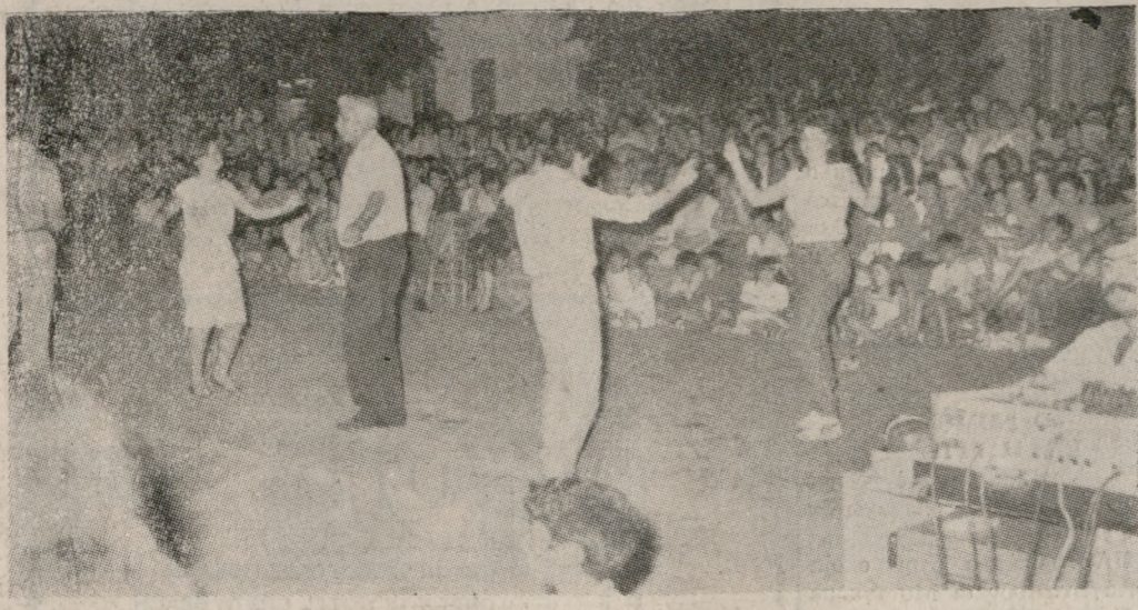
Οι κάτοικοι της Ν. Αλικαρνασού, γύρισαν το περασμένο Σαββατοκύριακο 61 χρόνια πίσω, και γιόρτασαν την επέτειο τους με διάφορες εκδηλώσεις. Ένα στιγμιότυπο από τις εκδηλώσεις αυτές έλεπε με την φωτογραφία μας.