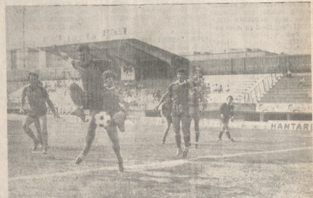
Η μπάλα έχει φύγει ήδη από το πόδι του Δούκα και σε λίγο θα καταλήξει στα δίχτυα της Πάτρας. Έχει προηγηθεί φάουλ - σέντρα του Ροδιτάκη.