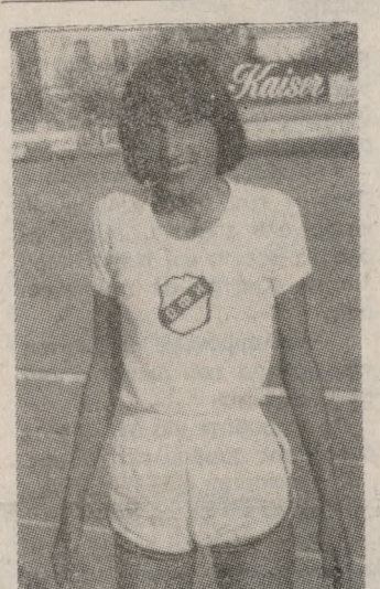
Η ΚΟΣΜΑΛΑΚΗ 4η ΣΤΑ 1000 Μ. ΤΩΝ ΠΑΝΕΛΛΗΝΙΩΝ

Η Μορφωτική και Ψυχαγωγική Λέσχη Προσωπικού ΟΤΕ Ηρακλείου διοργανώνει Πρωτάθλημα Ποδοσφαίρου μεταξύ ομάδων που τα μέλη τους εργάζονται στις Δημόσιες Υπηρεσίες και την «Κοινή Ψφείση», Νεοῦ Ηρακλείου. Οι όροι συμμετοχῆς στο Πρωτάθλημα είναι αυτοί που περιγράφονται στον Ειδικό Κανονισμό διεξαγωγῆς ποδοσφαιρικού πρωταθλήματος που συντάχθηκε από τη Λέσχη. Οι ομάδες που εκδήλωσαν ενδιαφέρον τους και θα συμμετέχουν στο Πρωτάθλημα είναι: 1. Χαροφυλακή 2. Καθηγητές 3 ΟΑΥΓΙΑ 4 ΟΤΕ 3 ΟΑΥΓΙΑ 4 ΟΤΕ Διεξαγωγῆς των αγώνων, μετά από κλήρωσι της Οργανωτικῆς Επιτροπῆς είναι: Α. 22-6-83 ΟΑΥΓΙΑ-ΧΩΡΟΦΥΛΑΚΗ Γήπεδο ΠΟΑ Ὁρα 17 30 Συνέχεια στη σελ. 5.