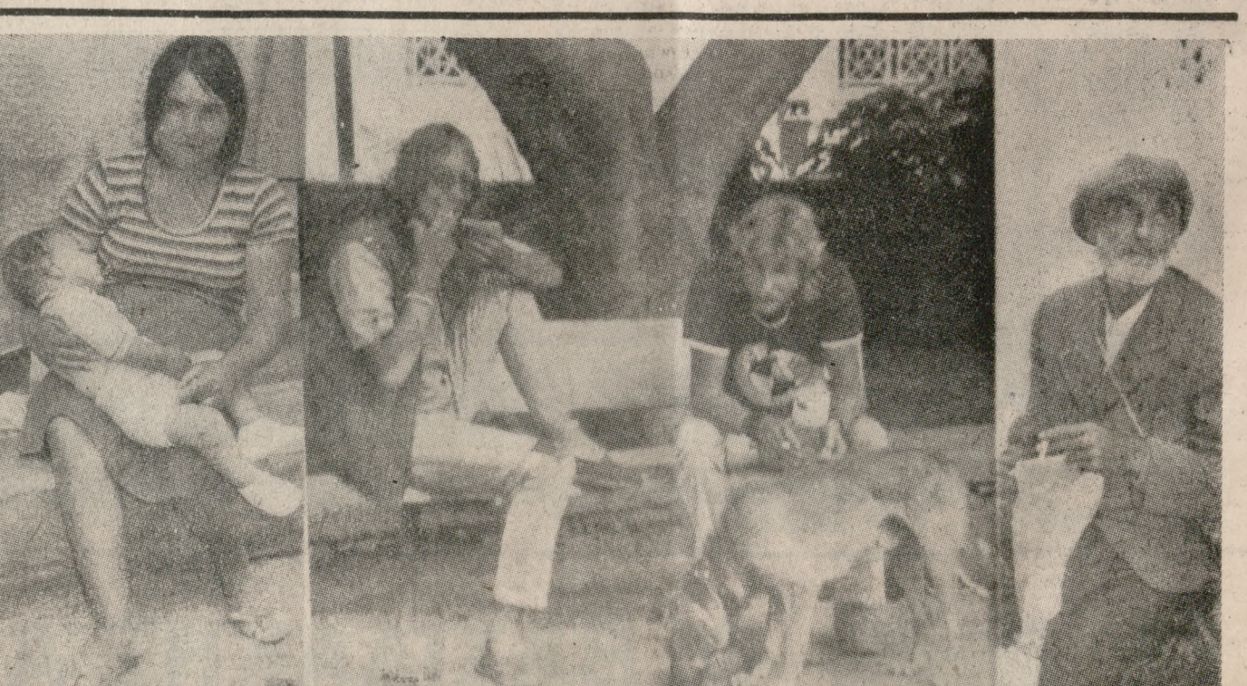
Στιγμές, που, αν εξαιρέσει κανείς την μεσοία φωτογραφία, δεν θάναυ σκληρό μα απλά αληθινό, να τις περιγράψει (νάταν τα μόνα!!!) αυτής της πολιτείας....