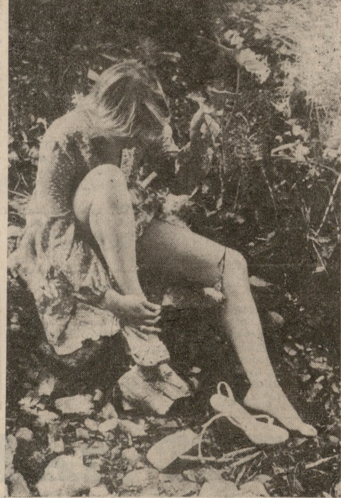
ΠΑΓΩΜΕΝΟΣ ΓΕΡΓΓ. ΠΟΡΤΡΑΙΤΟ ΤΗΣ ΛΙΖΑΣ

★—★ «ΤΟ ΠΟΡΤΡΑΙΤΟ της Λίζας». Πρώτος έπινοος στον διαγωνισμό της Ελληνικής Φωτογραφικής Εταιρείας. Ίσως τ' όνομα, ίσως