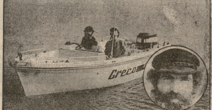
κλειο. «Θέλουμε, είναι, να ξεφυγούμε έστω και για λίγο, από το καουσερίο και το ταμπέντο...». Η απόσταση που θα διανύσουν: 174 ναυτικά μίλια. Αν' αυτό, στα 60 περίπου, το μπίλι δεν πάνει στερία. Είδατε τι κάνει το θαλωμένο... μάτι;

★—★ «ΔΟΥΛΕΙΑ δεν είχε ο διάλογος κι έτρωγε τα παιδιά του» λέει ο Λαός μας κι έχει δίκιο. Να ας πούμε: Δύο Αθηναίοι ξεκίνησαν προχθές από την Βουλιαγμένη με πλαστική βάρκα για το Ηράκλειο.