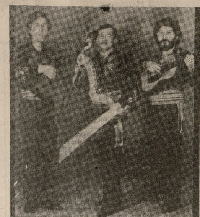
TRIO PARAGAVOS κάθε βράδυ και για όλη τη θερινή σεζόν τραγουδούν για σας. Τιμάι Ταβέρνας.