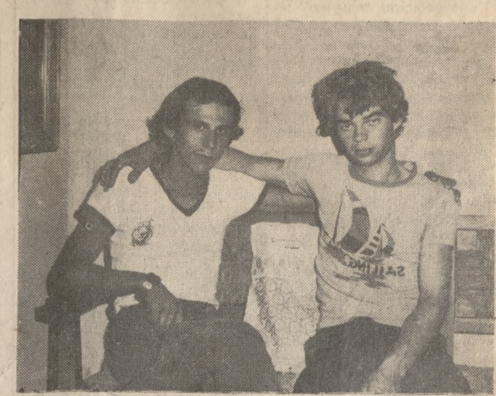
Δύο από τους ναυαγούς του «ΤΟΥΛΑ» ύστερα από την περιπέτειά τους, περιμένουν να μεταφερθούν στα σπίτια τους.

ΕΚΠΤΩΣΕΙΣ 30% στα έπιπλα Μπαμπού ΕΚΠΤΩΣΕΙΣ 30% στα έπιπλα Μπαμπού DALVERA ΕΚΠΤΩΣΕΙΣ 30% Σε όλα τα ψάθινα είδη.