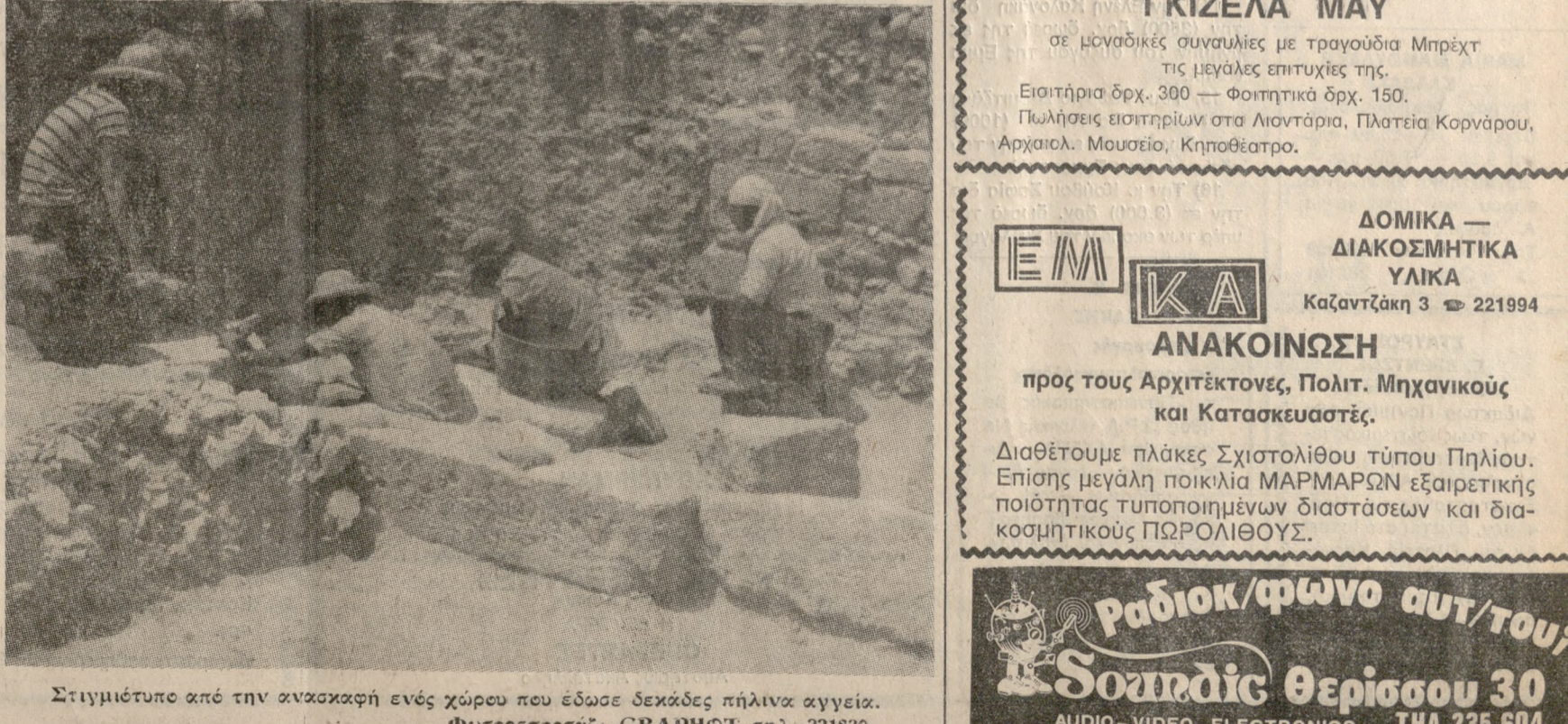
Στιγμιότυπο από την ανασκαφή ενός χώρου που έδωσε δεκάδες πήλινα αγγεία. Φωτορεπορτάς: GRAPHOT Τηλ. 221830