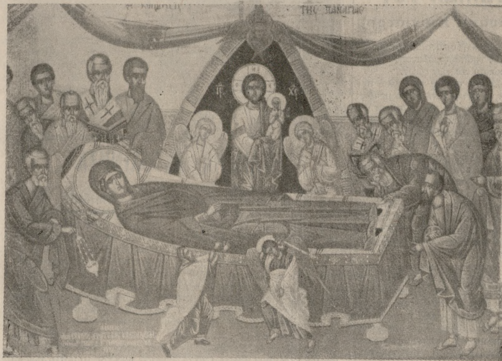
Έργο του αγιογράφου Ιερέα Γεωργίου Μανουσάκη.