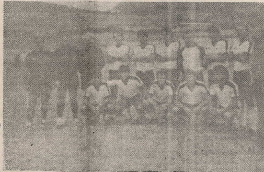
Ο Ο.Φ.Η., όπως παρατάχθηκε σ' ένα από τα φιλικά παιχνίδια που έδωσε στη Γερμανία.

απόγευμα ματς με την TUS Τσέλερ. Ο ΟΦΗ νίκησε με 3—1. 6 Αυγούστου: ενδιαφέροντα «παραλείποντα» από την αποστολή στη Γερμανία τα οποία θα φέρουμε στο φως