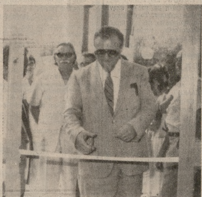
Ο Υπουργός Τεχνολογίας και Έρευνας, εγκαινιάζει επίσημα την λειτουργία του Ε.ΚΕ.Κ. Φωτορεπορτάζ: Ν. ΜΑΛΤΕΖΑΚΗΣ Γιαννιτσών 19

Με αυτά τα σημεία, ως σημεία αχμής, μπορεί κανείς να συνοψίσει την όλη δουλειά που έγινε χθες, και τις εντυπώσεις που άφησε καθώς οι ιδρυτές του ΕΚΕΚ το παρέλασαν επίσημα από τον κ. Λιάνη, ενημερώνοντας τους παριστάμενους για το παρελθόν, το παρόν, και το μέλλον του Κέντρου.