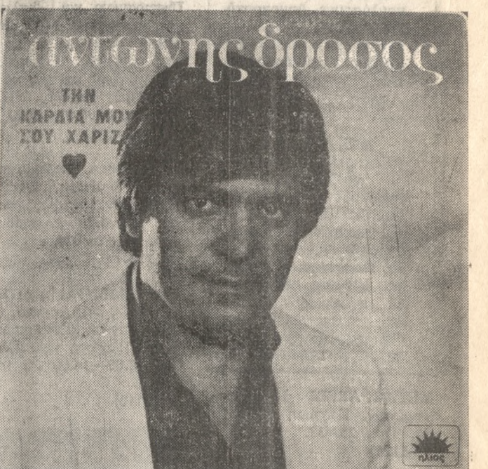
Κυκλοφόρησε ο ΝΕΟΣ ΔΙΣΚΟΣ του ΑΝΤΩΝΗ ΔΡΟΣΟΥ με 12 μεγάλες Λαϊκές Επιτυχίες, των μεγάλων δημιουργών Θ. ΑΓΓΕΛΟΥ, ΗΛ. ΤΡΥΦΩΝΙΔΗ, ΝΙΚ. ΜΠΑΞΕΒΑΝΗ, ΣΤ. ΘΕΩΔΩΡΑΚΟΠΟΥΛΟΥ, και άλλων γνωστών Συνθετών. ΖΗΤΗΣΤΕ ΤΟΝ από όλα τα Καταστήματα Δίσκων «ΤΡΑ».

τες όλα είχαν χαθεί. Ο Αλφρέδος έτρεξε στο γραφείο του, κι εκεί οι λαποδόντες είχαν εργασθεί... ευσυνήτητα. Τα συρτάρια ήταν σπασμένα και έλειπαν τα χρήματα για το ναίκει και το ράφτι. Πάνω σ ένα τραπέζι το ζευγάρι βρήκε ένα μπλιέτο με τις εξής φράσεις: «Σας ζητάμε συγγνώμη αν πήραμε το θάρρος το διάστημα που λείπατε να σας πάρουμε μερικά πράγματα που τα χρειάζομαστε. Καθώς η παρουσία σας θα ήταν ενοχλητική και σε σας και σε μας, θελήσαμε να σας αποχρημάσουμε κάπως δίνοντας σας τη χώρα με δέιτε μια θρατική παράσταση. Ξελπίσουμε ότι διασκεδάσατε αρκετά. Με πολλούς χαιρετισμούς Οττο Σβάρτς και Σίσα» Τότε μόνον κατάλαβε το ζευγάρι ότι είχαν πέσει θύματα ενός τεχνισματός λαποδοντών που τους έδωσαν.