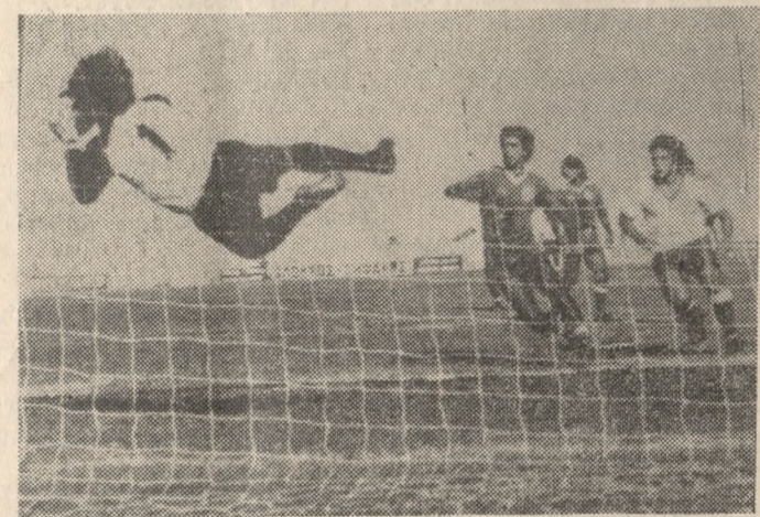
Ο τερματοφύλακας της Καλλιθέας αποκρούει, με δεξιακτική εκτίναξη σώζοντας την εστία του από παραβίαση.