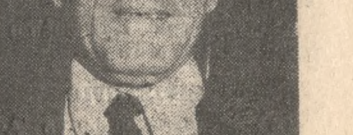
Ο κ. Καραμανλής δέχθηκε επίθεση σε συνεννόηση με τον πρώην υφυπουργό κ. Παπανδρέου, ο οποίος τον ενημέρωσε για την γενική κατάσταση της χώρας.

Πάντος σύμφωνα με δημοσιογραφικές πληροφορίες ο πρώην υφυπουργός κ. Παπανδρέου ενώ μερικές τον Πρόεδρο της Δημοκρατίας, για την επικείμενη υπογραφή της Ελληνοαμερικανικής συμφωνίας για τις βάσεις για την Ελληνική πρωτοβουλία για την αναβολή εγκατάστασης των Ευρωπαϊκών Πέρετρων και Κρούς, την οποία όπως είναι γνωστό πρόκειται να φέρει προς σύληψη ο υφυπουργός Εξωτερικών κ. Χαραλαμπίδης στην Σύνοδο υφυπουργών εξωτερικών της ΕΟΚ για την πολιτική συνεννόηση στις 12 του μηνός, καθώς επίσης και για την μικρή έκταση ανακατάταξη στον οικονομικό τομέα της κυβέρνησης μετά την παραίτηση του υφυπουργού Οικονομικών κ. Κουλουριάνου.