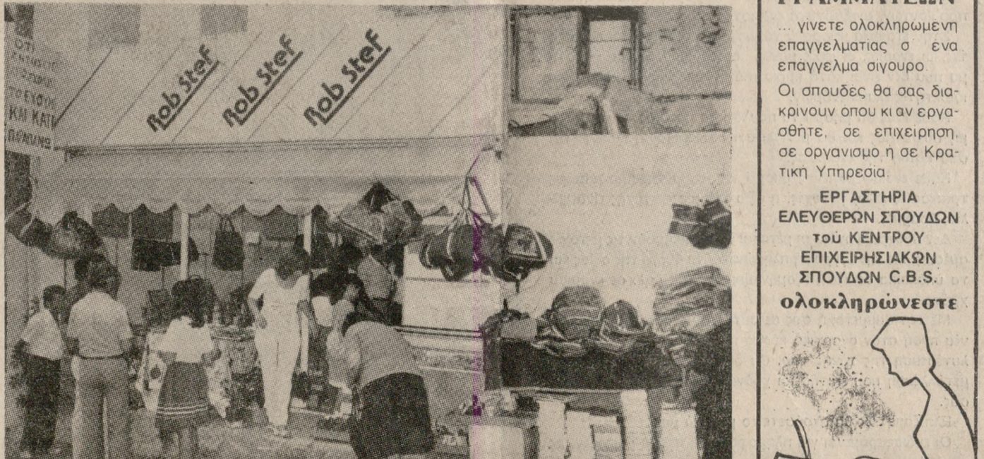
Ένα νέο Κατάστημα Σχολικών ειδών, έκανε τα εγκαίνια του. Ευρίσκεται στην οδό ΨΑΡΟΜΙΔΗΚΩΝ 14. Με τις τρελές τιμές κόστους. (Ο ΨΗΛΟΣ ΜΕ ΤΟ ΚΑΡΟΤΣΙ).

Δελημάρκου 6 και Δημοκρατίας τηλ. 283388 — 288314 — 281590