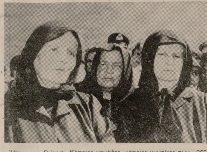
Ήταν στη Βιάννα. Κάποιες μονάδες, κάποιες γυναίκες των 359. Την Κυριακή τους ξανάκλαψαν, με τη ζωή τραβεί την ανηφόρα...

Η ΦΡΙΚΗ απλόθηκε στη ζωή τους στις 14 του Σεπτεμβρίου του 1943. Αποτυπώθηκε στη μνήμη τους με τα νεκρά παλληκάρια άντρες και γιούς τους και πορεύτηκε μαζί τους 40 ολόκληρα χρόνια.