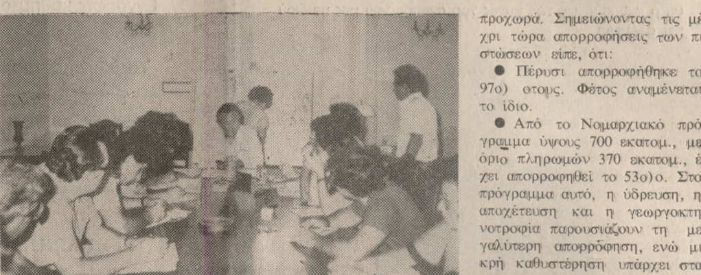
Στην επίσημη σύσκεψη στην Νομαρχία...

Πέλοπος—Σάμος—Ικαρία—Αστράκλια—Σητεία. Θα διαρκεί 30 ώρες περίπου.