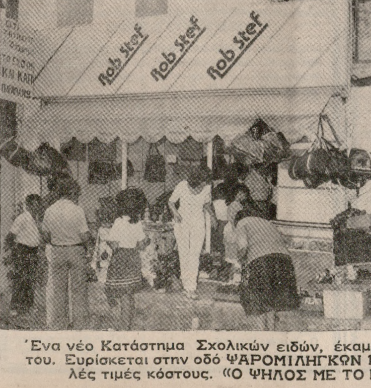
Ένα νέο Κατάστημα Σχολικών ειδών, έκαμε τα εγκαίνια του. Ευρίσκεται στην οδό ΨΑΡΟΜΙΛΗΓΚΩΝ 14. Με τις τρελές τιμές κόστους. «Ο ΨΗΛΟΣ ΜΕ ΤΟ ΚΑΡΟΤΣΙ».

Να παρουσιάσουν σήμερα στον τόπο που γράφει το Ειδικό Φύλλο Πορείας τους, για να λάβουν μέρος στην 'Ασκήση «ΑΓΡΥΓΝΟΣ ΦΡΟΥΡΟΣ 83» που θα διαρκέσει δέκα (10) ημέρες. Όσοι βρίσκονται μακριά από τον τόπο παρουσιάσεως, που γράφεται στο Ειδικό Φύλλο Πορείας, να μη χρονοπούν να παρουσιάσουν αμέσως στα κατά τόπους Φρουραρχεία ή Κέντρα διερχομένων Στρατιωτικών ή στις Αστυνομικές Αρχές για να πάρουν κατάσταση επιβίβασης και οδηγίες για την κίνησή τους. Οι καλούμενοι έφεδροι πριν αναχωρήσουν για τη Μονάδα τους να διαθέσουν προσεκτικά τις οδηγίες που είναι γραμμένες στο πίσω μέρος του Ειδικού Φύλλου Πορείας. Η ανακίνηση αυτή μεταδίδεται και από τους αριθμούς 111 και 115 του ΟΤΕ.