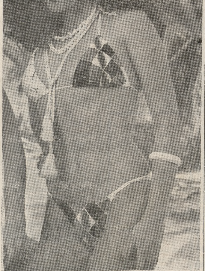
Η «ΜΙΣ ΕΛΛΑΣ» ΑΡΙΑΝΝΑ ΔΗΜΗΤΡΟΠΟΥΛΟΥ που θα παρουσιάσει απόψε τις φιλοσοφίες.

Γίνεται επίσης γνωστό ότι προετοιμάζεται να διατεθούν και στην είσοδο του «ΑΚΤΗ ΖΕΥΣ» ενώ καθ' όλη την ημέρα πληροφορίες για τα καλλιτεχνικά θα δίδονται στις τσέψες.