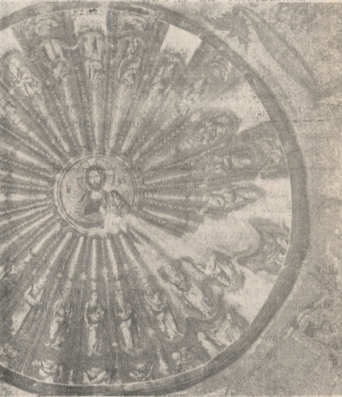
ΜΟΝΗ ΤΗΣ ΧΩΡΑΣ

Ο τρούλος του νοτιού τμήματος. Στη μέση ο Ιησούς και τριγύρω οι πρόνευί Του.