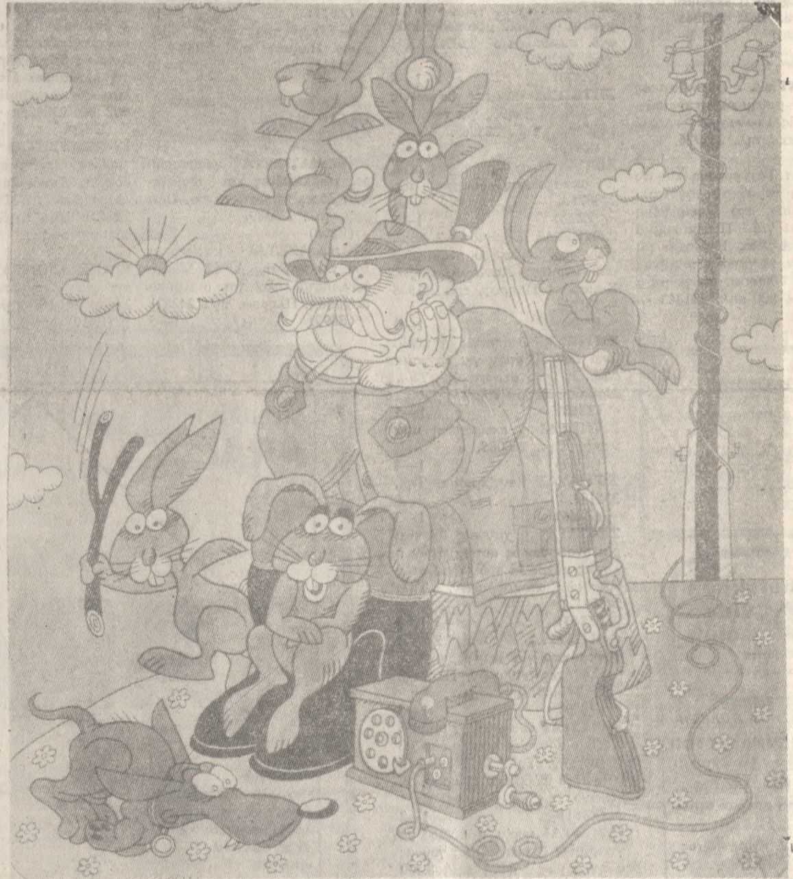
Αφιερωμένο στους Κυνηγούς.

Προσωπικά εγώ δεν έβγαλα σαν παιδί ποτέ ξύλο. Και δεν είμαι κακοαναθρεμμένη. Δεν έβγαλα όλα αυτά που επικαλούνται όσοι πιστεύουν ότι το ξύλο βγήκε από τον Παράδεισο. Κι ακόμα, ποτέ δεν έχω δειρει παιδί, κι ως είμαι και νευρικότατη. Κι εξακολουθώ να πιστεύω ότι τα παιδιά χρειάζονται ό,τιδήποτε άλλο, εκτός από ξύλο.