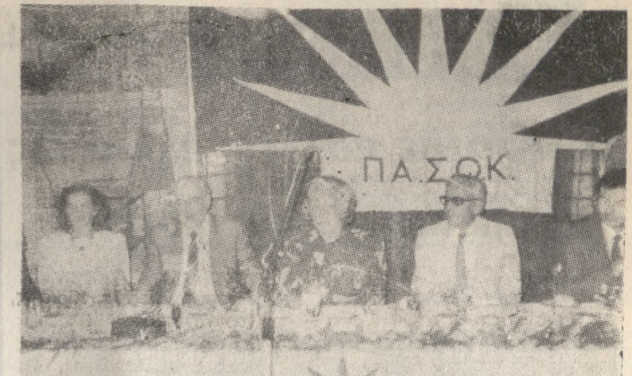
Ένα ακόμη στιγμιότυπο από την συνέντευξη στον «Αστέρα» της Ελούντας. Φωτ.: Μίρης ΛΙΟΝΤΟΣ τηλ. 221332