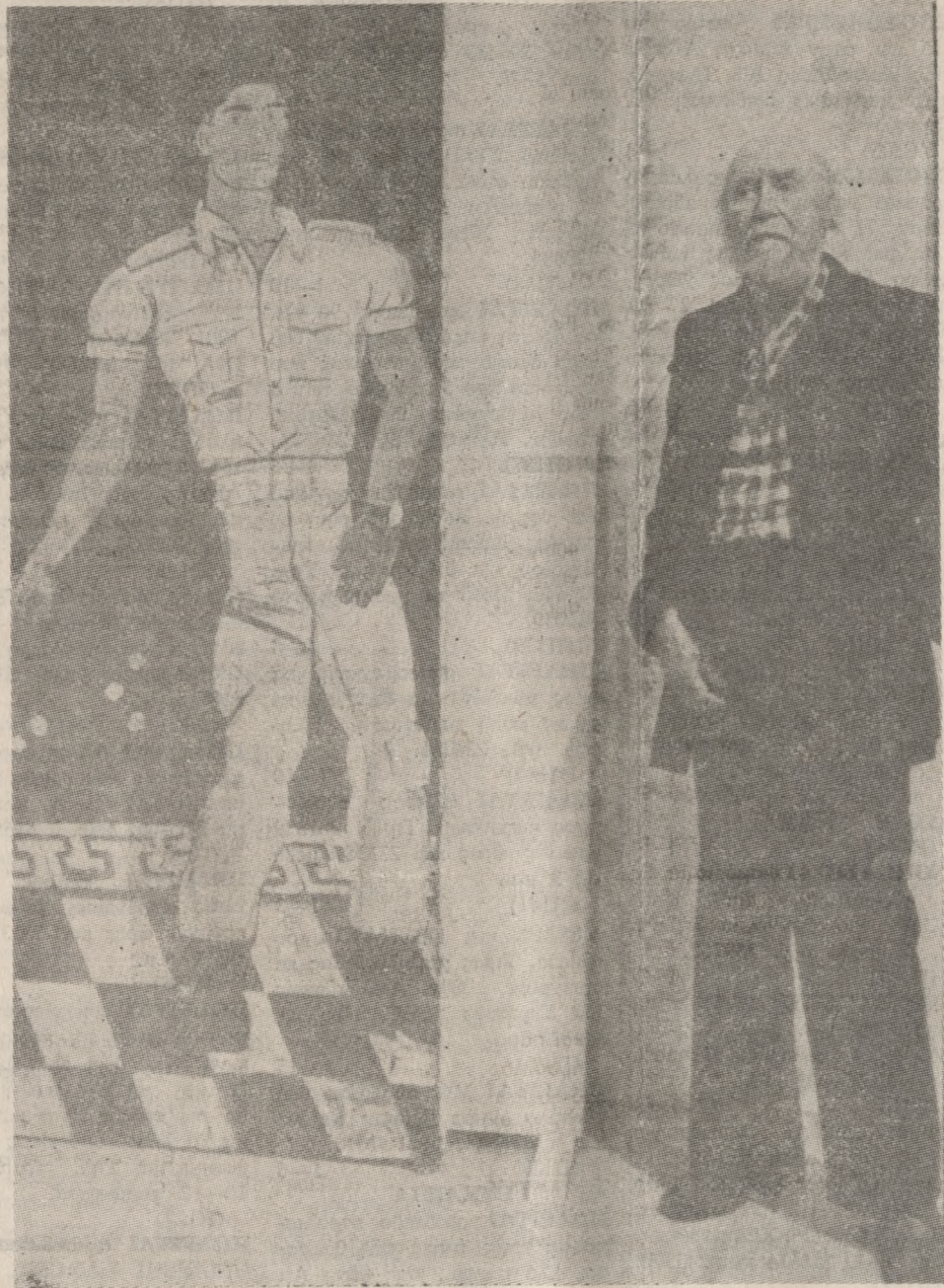
Γιάννης Τσαρούχης Ανδρέας Εμπειρικός

«...η μεγάλη αξία του Εμπειρικού δεν έγκειται στο ότι υπήρξε σουρεαλιστής, αλλά ότι έδωσε ένα νόημα στο σουρεαλισμό. Οι κενητόρες θέλον σχέδια για να κεντάνε αλλά κάποιος πρέπει να κάνει αυτά τα σχέδια. Ο Ανδρέας Εμπειρικός ήταν απ' αυτούς που φτιάχνουν σχέδια, και για να το πούμε αλλιώς, που δημιουργούν νέες αξίες όταν οι παλιές δεν εξυπηρετούν πιά τον σκοπό για τον οποίο υψώθηκαν...».