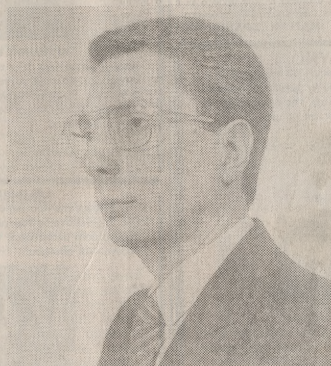
Ο ΠΡΟΕΔΡΟΣ ΤΟΥ ΚΟΜΜΑΤΟΣ ΦΙΛΕΛΕΥΘΕΡΩΝ κ. ΝΙΚΗΤΑΣ ΒΕΝΙΖΕΛΟΣ

του Ελευθερίου Βενιζέλου, τον οποίο είχε συνεχώς κοντά του. Σπούδασε στο Πανεπιστήμιο της Νότιας Καλιφόρνια, Οικονομικές Επιστήμες. Με την πολιτική ασχολήθηκε