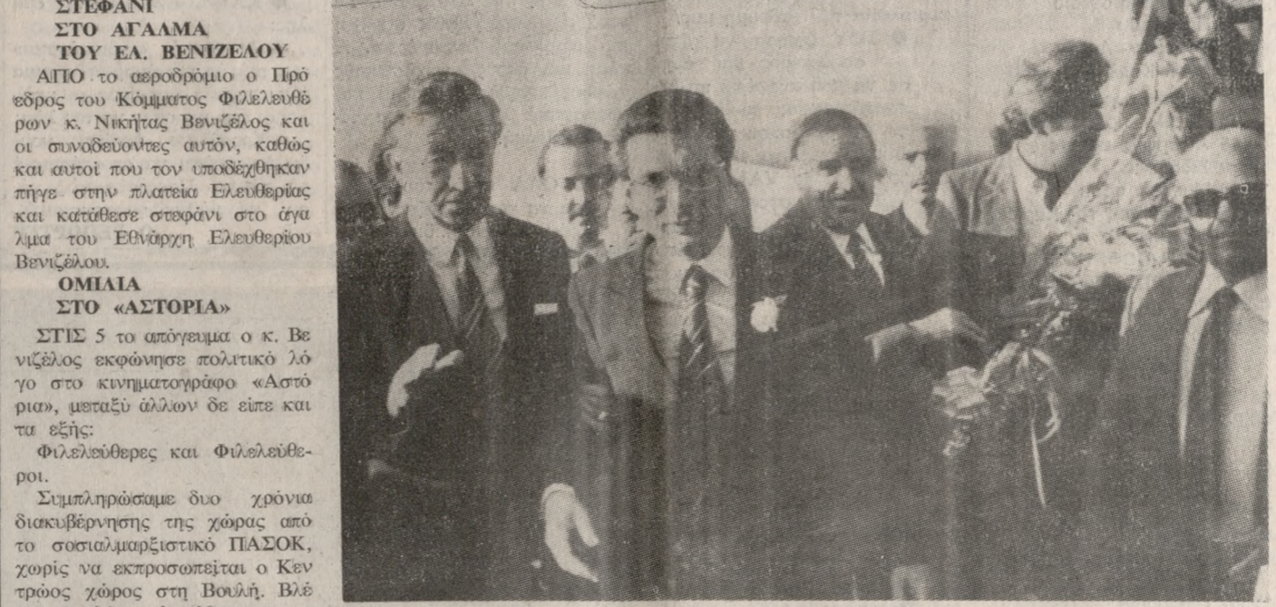
Ένα στιγμιότυπο από τη χθεσινή άφιξη του Προέδρου του Κόμματος Φιλελευθέρων κ. Νικήτα Βενιζέλου.

«Με μεγάλη χαρά βρισκόμαστε και πάλι στο Ηράκλειο, που υπήρξε πάντοτε το προπύργιο της Δημοκρατίας και του Φιλελευθερισμού... (Text continues with the speech content.)