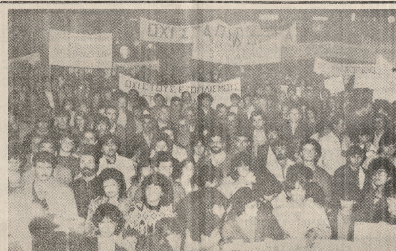
Ηρακλειώτες κάθε ηλικίας, τάξης, επαγγέλματος και πολιτικής τοποθέτησης, συγκεντρώθηκαν χθες και είπαν «ΟΧΙ ΣΤΟΥΣ ΚΡΟΥΖ», «ΝΑΙ ΣΤΗΝ ΕΙΡΗΝΗ». Στη φωτ)φία μας ένα στιγμιότυπο από την συγκέντρωσή τους.