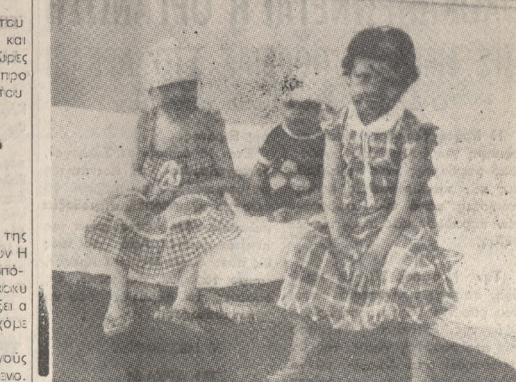
Μόνη φίλη της να βελτιωθεί η κατάσταση τους είναι να πάει στο εξωτερικό και ίσως τότε τη τη στείλει να έχουν όφελος, για να υποβληθούν σε σειρά ε χειρήσεων. Όπως χρειάζονται πολλά χρήματα.

Ήταν Φεβρουάριος 1983. Τα τρία ανάπλα κοριτσάκια 2, 3 και 5 ετών της οικογένειας ΠΑΡΑΣΟΓΛΟΥ έμειναν μόλι, από την Ιερή Αγάθη εχρημάτισε σε μια πρόχειρη σκηνή για να προστατευθούν από τις καιρικές συνθήκες σε κάποιο λούτρο. Οι γονείς πιο πέρα, απρόθυμοι καθώς ήταν μάλλον ελπίες.