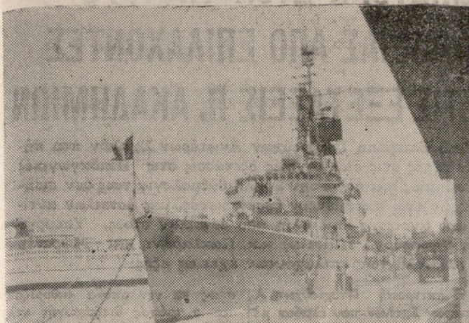
Από προχθές βρίσκεται στο λιμάνι μας η γαλλική κορβέτα «Κορσεβίτ» με επίσκεψη φιλοφροσύνης.