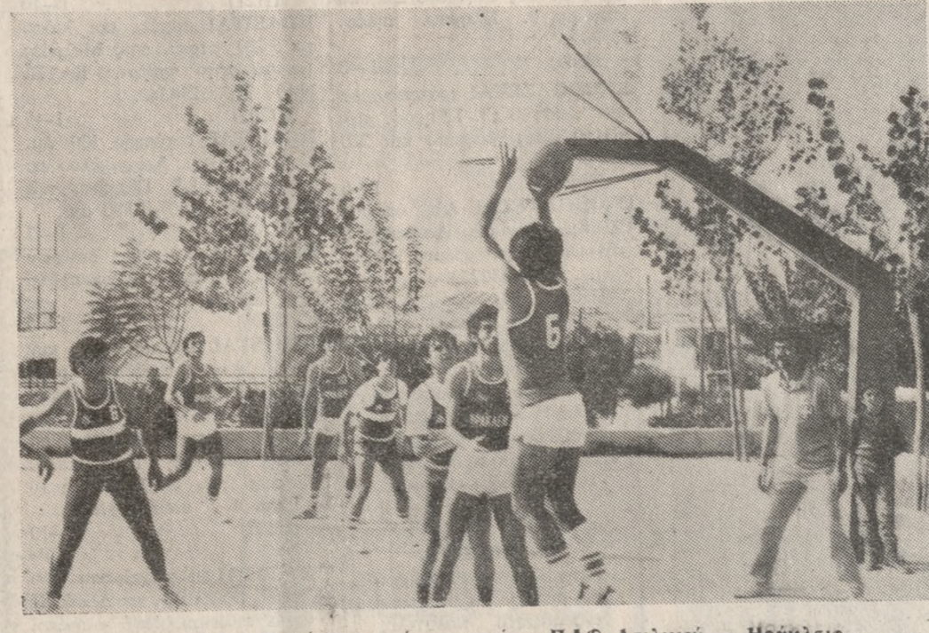
Ένα στιγμιότυπο από τον αγώνα ΠΑΟ Δελινού — Ηράκλειο.