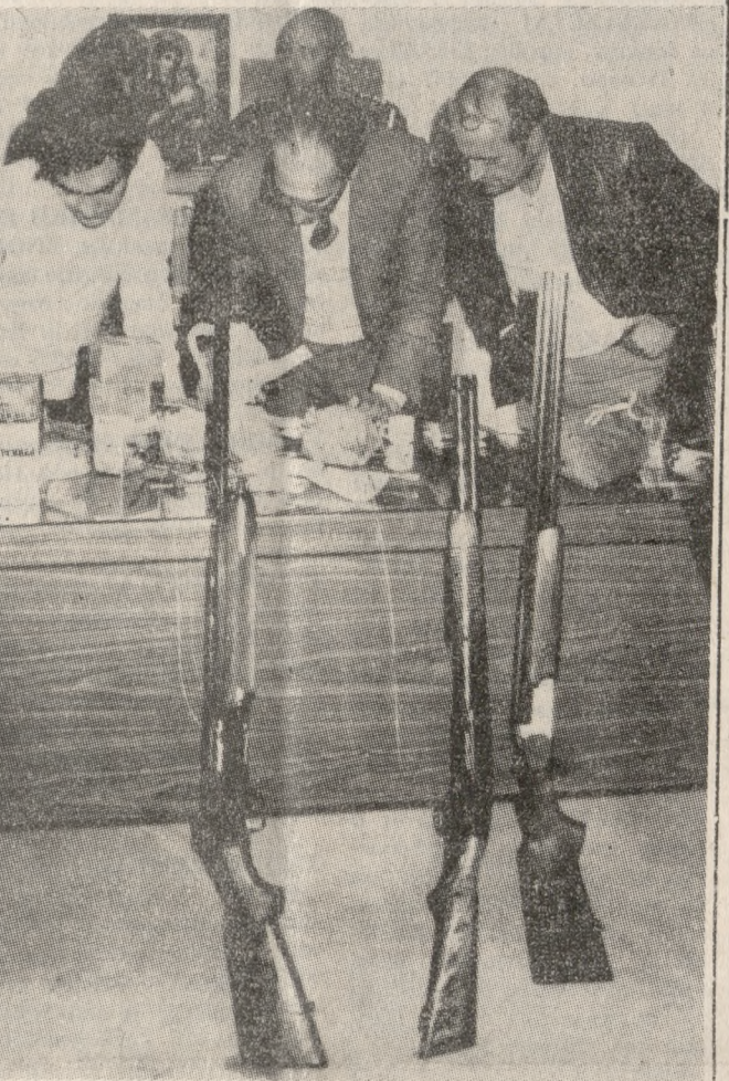
Τρεις από τις πέντε κασμιρίνες που χρησιμοποιήσαν οι δράστες, μαζί με ό,τι έκλειψαν.

ΕΡΩΤΗΜΑΤΟΛΟΓΙΑ της Τ.Ε. Καλαθοσφαίρισης Κρήτης η κλήρωση του γυναικείου πρωταθλήματος μπάσκετ που θα διεξαχθεί σε τρεις ομίλους.