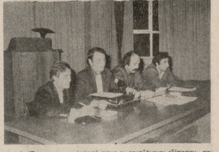
«Ετσι, στη συνάντησή τους οι εργαζόμενοι εξέτασαν τα συγκεκριμένα προβλήματα τους και πρότειναν αντίστοιχες λύσεις. Στην φωτογραφία συνδικαλιστικά στελέχη του ΟΤΕ.

ΑΠΟΦΕΙΣ γύρω από τα προβλήματα — συνδικαλιστικά και τεχνικά — που τους απασχολούν, ανταλλάξαν το βράδυ της Πέμπτης στο ΕΒΕΗ οι εργαζόμενοι στον ΟΤΕ, με στελέχη της Ομοσπονδίας τους που ήρθαν στην πόλη μας ακριβώς για τον σκοπό αυτό.