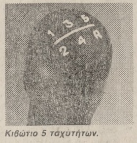
Κιβώτιο 5 ταχυτήτων.

Άλλα ένα Ronda είναι κάτι πολύ περισσότερο από το να είναι πολυτελές. Είναι και άνετο (με 5 πόρτες και πλούσιους χώρους). Είναι και οικονομικό (στην 5η ταχύτητα και με 90 χλμ. την ώρα χρειάζεται μόνο 5,4 λίτρα βενζίνης για 100 χιλιόμετρα!). Είναι και σύγχρονο (με αντισκωρική προστασία για 6 χρόνια, αυστηρά ελεγμένη κατασκευή, και επίλεκτο, έκτεταμένο δίκτυο σέρβις και πάντα διαθέσιμα ανταλλακτικά). Και πέρα απ' όλα αυτά είναι ένα αυτοκίνητο με υψηλή απόδοση και γεμάτο «ενέργο».