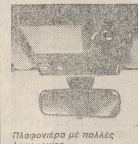
Πλαφονιέρα με πολλές λειτουργίες.