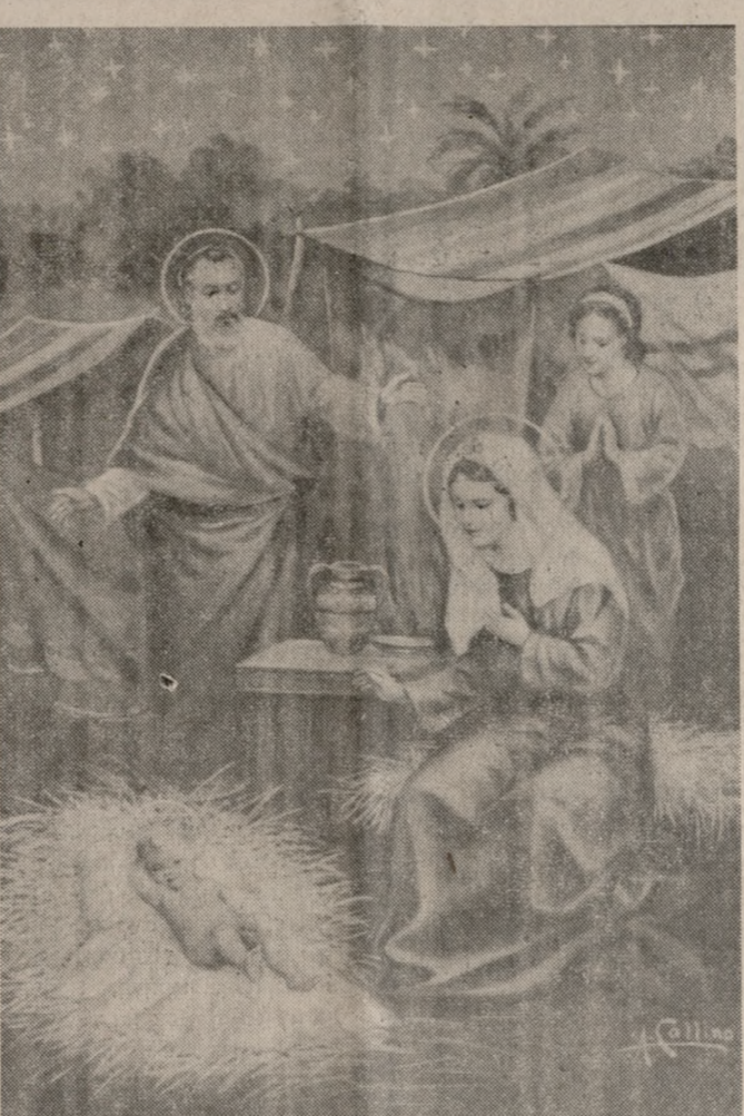
(Χριστός γεννάτε δοξάσατε...)