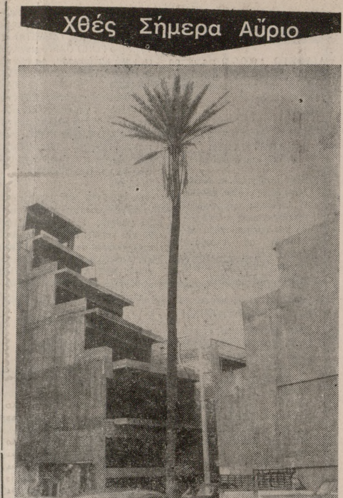
ΕΝΑΣ Φοινίκας κινδυνεύει. Πρόκειται για το τερσάσιο φοινικόδενδρο που υψώνει κατακόρυφα την περιφέρειά του επί πολλές δεκαετίες στο οικοπέδο της αρχής της οδού Θεοτοκοπούλου κάτω από το ομώνυμο πάρκο. Θα πρέπει λοιπόν να προστατευθεί από το πανύψηλο δένδρο, εφόσον φυσικά δεν αποτελεί εμπόδιο στην αξιοποίηση του χώρου και στην πολεοδομία. Στη φωτογραφία μας ο περήφανος φοινίκας που ανατείλει στον ουρανό