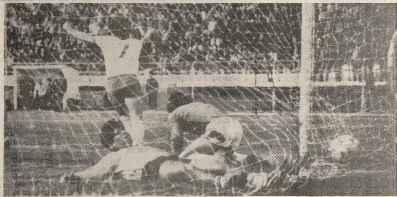
Η μπάλλα βρίσκεται στα δίχτυα του Βύζαντα και οι γηπεδούχοι πανηγυρίζουν. Η χαρά από την επίτευξη του τέρματος αυτού θα διαρκέσει μόλις ένα λεπτό!