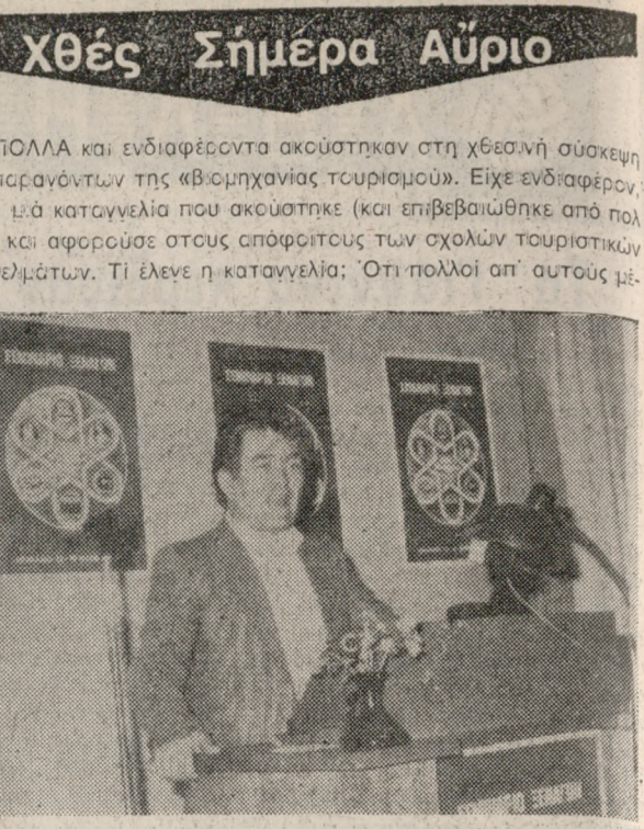
ΠΟΛΛΑ και ενδιαφέροντα ακούστηκαν στη χθεσινή σύσκεψη των παρανότων της «Βιομηχανίας τουρισμού». Είχε ενδιαφέρον, όμως, τα καταγέλια που ακούστηκαν (και επιβεβαιώθηκαν από πολλούς) και αφορούσαν στους απόφοιτους των σχολών τουριστικών επαγγελματιών. Τί έλεγε η καταγέλια; Ότι πολλοί απ' αυτούς με...

ΟΙ ΑΡΧΙΤΕΚΤΟΝΕΣ ΑΠΑΝΤΟΥΝ Συνέχεια από την 1η σελ. για περιπτώσεις όπως πλάτ, Δασκαλογιάννη, Πάτ. Αγ. Πίτ. του πελοχίου γυρω από την Πλατεία Αγ. Αικατερίνης, Πάτ. Υγειονομικού κέντρου, δεν δόπρατε εσπευσμένα να επιχειρηθεί η αποφυγή προεπιλεγμένων μεθόδων στους μελετητές του λεοβαρικού και Κυκλοφοριακού Σχεδιασμού.