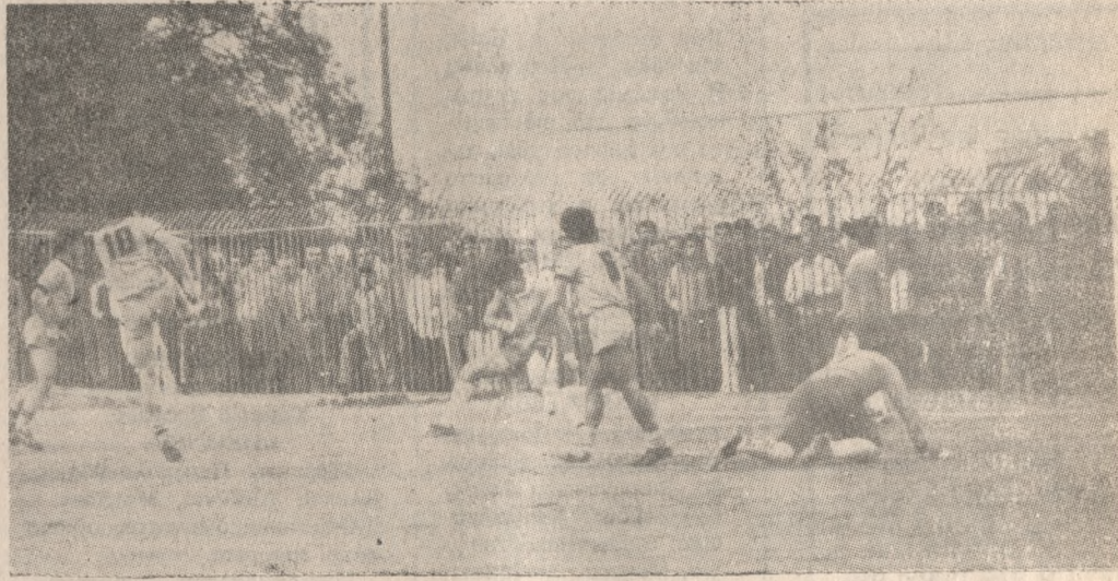
Ο Γκιλομάς (№ 10) με άψογο στυλ σημειώνει το τέταρτο γκολ του Εργατέλη, διαμορφώνοντας και το τελικό αποτέλεσμα σε 4-0.

• ΔΙΑΦΗΜΙΣΤΕΣ του πιο λαοφιλέως αθλήματος στον κόσμο, έγιναν οι ποδοσφαιριστές του ΠΑΣ Γιάννινα και του ΟΦΗ στον αγώνα που έδωσαν την Κυριακή στο Εθνικό Στάδιο Ιωαννίνων, όπου η τοπική ομάδα νίκησε το Ηρακλειώτικο συγκρότημα με σκορ 2-0. Λέγε διαφημιστές, γιατί το θέμα που παρουσίασαν οι 26 ποδοσφαιριστές ήταν συγκλονιστικό και κράτησε αμείωτο το ενδιαφέρον των 6.000, περίπου, θεατών και στα 90' λεπτά του αγώνα. Οι ωραίοι συνδυασμοί, οι θεαματικές μονομαχίες των παικτών, τα σουτ, οι συγκλονιστικές φάσεις στις δύο εστίες, ήταν τα στοιχεία εκείνα που κατατάσσουν τον αγώνα αυτό στους καλύτερους του φετινού πρωταθλήματος της Α' Εθνικής Κατηγορίας. Πέρα από τα παραπάνω, όμως, αξιοσημείωτη είναι η πτώση του ΟΦΗ στο Β' ημίχρονο, οπότε και δέχτηκε και τα δύο γκολ. Στο Α' μέρος η ομάδα του Ηρακλείου δεν άφησε περιθώρια στον ΠΑΣ να αναπτυχθεί και έχασε δύο καλές ευκαιρίες να προηγηθεί. Συγχρόνως τα Γιάννινα παρουσίασαν μια νευρική όρεξη, έκαναν συχνά λάθη και δύο φορές γνώρισαν την ατυχία όταν έχασε πέναλτυ ο Παπαχρήστου και όταν είχε δοκάρει ο Λιάκος. Στο Β' μέρος η μορφή του αγώνα άλλαξε, με τον ΠΑΣ να έχει «στριμύζι» τον ΟΦΗ που κατάφερε να «λύσει την πολιορκία» δεκαπέντε λεπτά, περίπου, πριν από τη λήξη του αγώνα, χωρίς όμως να πετύχει τίποτα το θετικό. Αλλά ως δούμε με περισσότερες λεπτομέρειες την εικόνα του αγώνα.