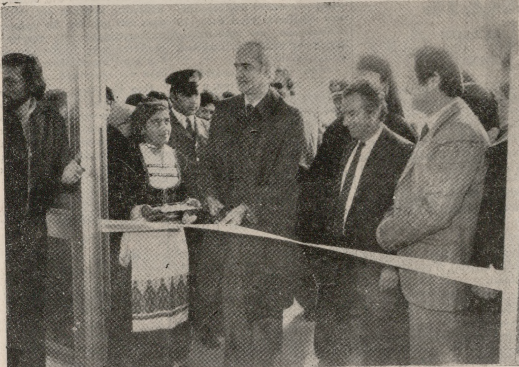
Απέ την τελετή των εγκαινίων ενός από τα τρία διδακτήρια, όπου βλέπουμε, τον Υπουργό Παιδείας κ. Κακλαμάνη να κόβει την καθιερωμένη κορδέλλα.