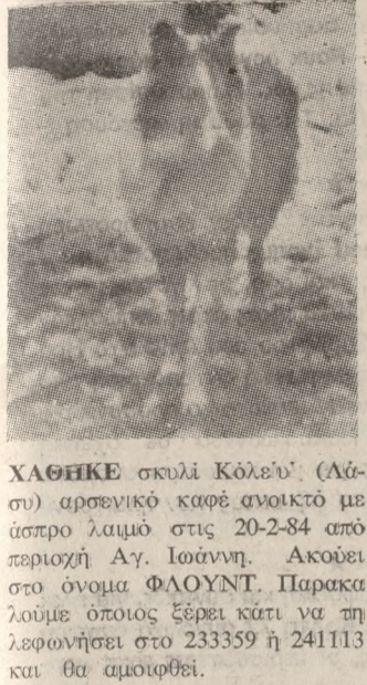
ΧΑΘΗΚΕ σκυλί Κόλεϊν' (Αδέσιο) αρσενικό κοφτερό ανοικτό με ύψος λαμού στις 20-24 εκ...