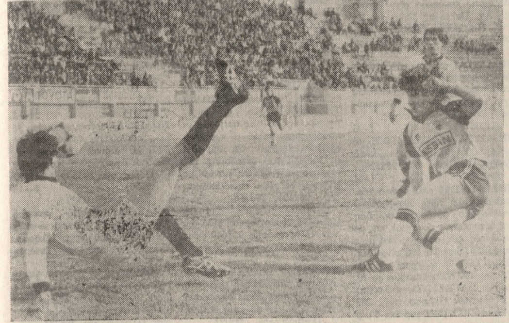
Το δεύτερο γκολ της ΑΕΚ που σημειώνει ο Μάυρες. Αριστερά είναι ο Αγιεζμίτης και δεξιά ο Αλεξίου.