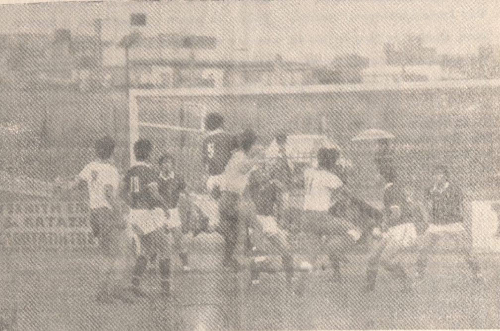
Ένα στιγμιότυπο από τον αγώνα Ηρόδοτος — "Αρτα" (0—0).

ΤΥΧΗ και Διαιτητής, δεν ήθελαν τον Ηρόδοτο στο παιχνίδι της Κυριακής με την "Αρτα". Έτσι, η ομάδα της Αλικαρνασσού έχασε άλλο ένα πολύτιμο βαθμό και βλέπει τώρα την Β' Κατηγορία να απομακρύνεται. Χωρίς ν' αποδώσει σύμφωνα με τις δυνατότητες της η ομάδα της Αλικαρνασσού, είχε τον έλεγχο του παιχνιδιού σ' όλη του την διάρκεια, «έφτιαξε» ευκαιρίες τις οποίες δεν μπόρεσε να αξιοποιήσει. Νωθρά ξεκίνησαν και οι δύο ομάδες το παιχνίδι χωρίς να παρουσιάσουν τίποτα το αξιολογικό στο πρώτο 15λεπτο. Από το 15' ο Ηρόδοτος άρχισε να ανεβάζει την απόδοσή του και να πιέζει την "Αρτα", η οποία είχε και τους έντεκα παίκτες της σε αμυντική διάταξη.