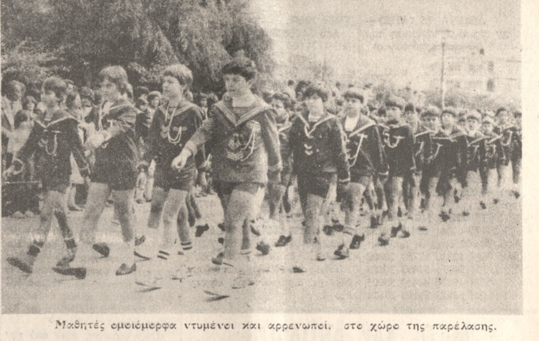
Μαθητές ομοεισμορφα ντυμένοι και αρρενωποί, στο χώρο της παρέλασης.