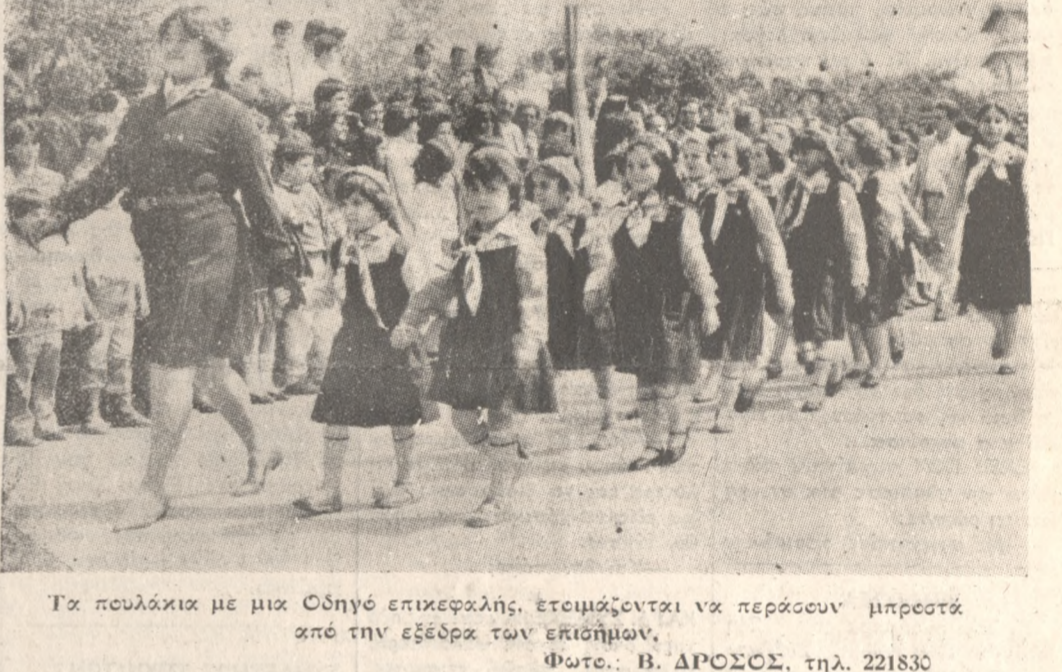
Τα πουλάκια με μια Οδηγό επικεφαλής, ετοιμάζονται να περάσουν μπροστά από την εξέδρα των επίσημων.