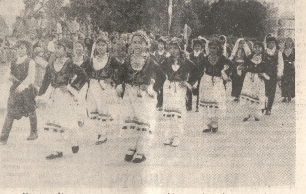
Μικρές μαθήτριες με χαρακτηριστικές σκελές, περνούν πρό των επισήμων.