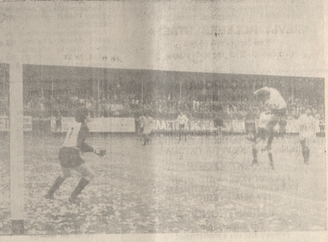
Μία φάση από τον αγώνα του α' γύρου μεταξύ ΟΦΗ — Ολυμπιακού, που είχε λήξει ισόπαλος, χωρίς τέρματα. Στο ματς αυτό ο διαιτητής κ. Αγγελάκης είχε «πνίξει» δύο καταφανέστατα πέναλτυ υπέρ του ΟΦΗ.

Πρωτάθλημα Κορασίδων ΓΙΑ την τελική φάση του πρωταθλήματος Κορασίδων, η οποία