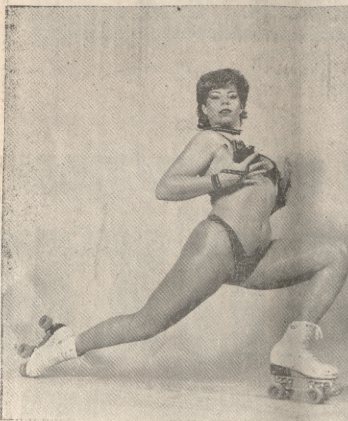
«SILVIA ROLLERS STREP»

Ένα ξεχωριστό θέμα στο ανανεωμένο μας πρόγραμμα.