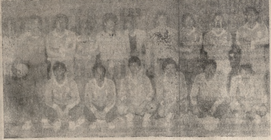
Η ομάδα βόλλευ του ΟΤΕ, η οποία κέρδισε στον πρώτο αγώνα του πρωταθλήματος Εργαζομένων την ομάδα των Καθηγητών Γυμνασίων με 3-1 σετ.