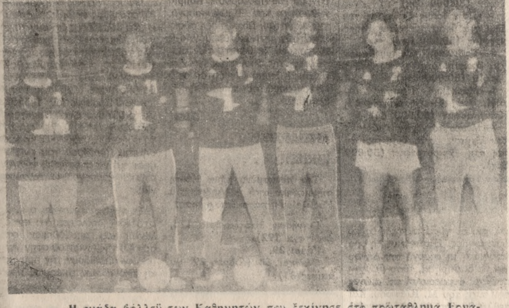
Η ομάδα βόλλευ των Καθηγητών που ξεκίνησε δτε πρωταθλήμα Εργαζομένων με μιά ήττα.