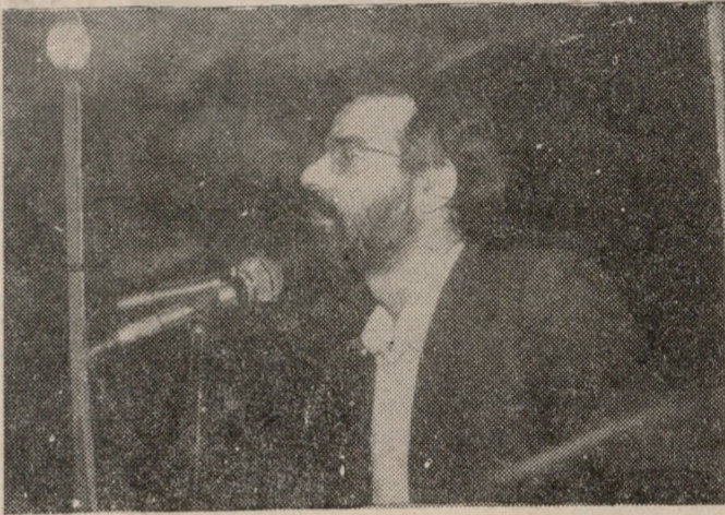
Ομιλητής της προχθεσινής συγκεντρώσης...