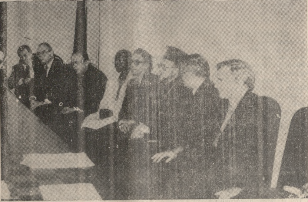
Μέλη της Επιτροπής Πίστης και Τάξης, χθες το πρωί στο Μέγαρο της Ιεράς Αρχιεπισκοπής Κρήτης.