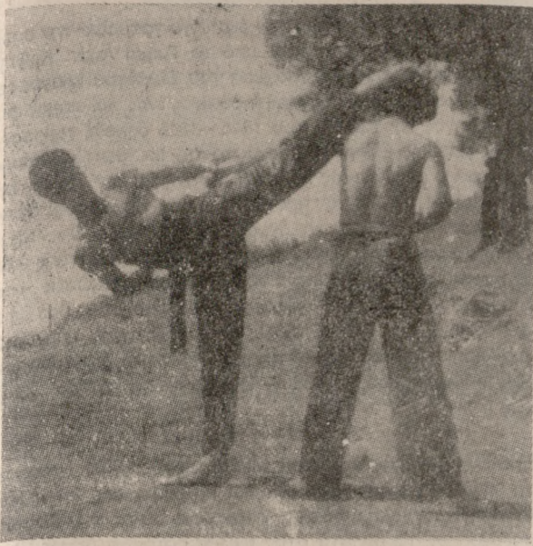
Θα σας είναι γνωστό το όνομα του