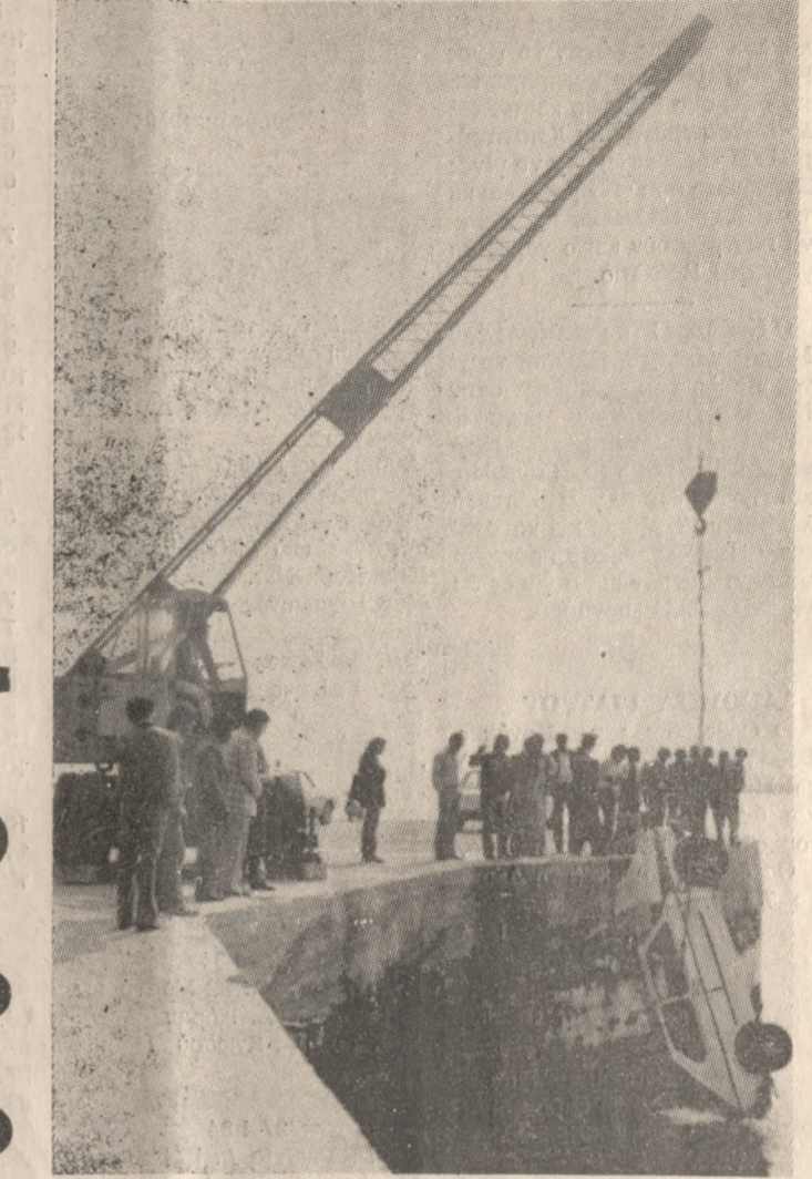
Το FIAT - νεκροφόρα ενώ ανασύρεται από τη θάλασσα.

Λίγες μόλις ώρες πριν το FIAT πέσει στην θάλασσα, άρχισε η αντίστροφη μέτρηση του οδοιπορικού προς τον θάνατο, των τριών παιδιών. Ήταν στις 11.30 το βράδυ, όταν παρέα με άλλα 10 άτομα, οι τέσσερις του μοιραίου αυτοκινήτου, βρέθηκαν γιορτάζοντας τα γενέθλια μιας κοπέλας της συντροφιάς, σε ταβέρνα του Ηρακλείου. Με την λήξη του ωραρίου λειτουργίας του μαγαζιού στις 2 δηλαδή τα ξημερώματα, η 14μελής παρέα, αποφάσισε να πάει βόλτα στο λιμάνι. Μοιράστηκαν στα τρία αυτοκίνητα που υπήρχαν και προχώρησαν προς τον Λιμενοβραχίονα να, μπαίνοντας μέσα σ' αυτόν, παρά τις απαγορευτικές πινακίδες που υπήρχαν στην είσοδό του. Έφθασαν να αυτοκίνητο στο πέγραμμα της διαδρομής, στον φάρο, και οι επιβάτες τους και πέβηκαν ενια να κάνουν ένα ταξίδι» όπως είπαν. Μοιράστηκαν στα τρία αυτοκίνητα που υπήρχαν και προχώρησαν προς τον Λιμενοβραχίονα να, μπαίνοντας μέσα σ' αυτόν, παρά τις απαγορευτικές πινακίδες που υπήρχαν στην είσοδό του. Έφθασαν να αυτοκίνητο στο πέγραμμα της διαδρομής, στον φάρο, και οι επιβάτες τους και πέβηκαν ενια να κάνουν ένα ταξίδι» όπως είπαν. Το τι έγινε από εκεί και πέρα και ως την στιγμή του θανάτου τους για τους τρεις δεν είναι γνωστό. Εκάλεται —καθώς η νεκροψία δεν έχει δώσει επίσημα τις απαντήσεις της— ότι η Παπαδάκη «έσκαψε» από τον φάρο της, και ότι οι άλλοι δύο πνίγηκαν στην προσπάθειά τους να σωθούν. Το σώμα μί λιστα του ανορίου βρέθηκε με σοβαρά τραύματα απ' την πόρτα του