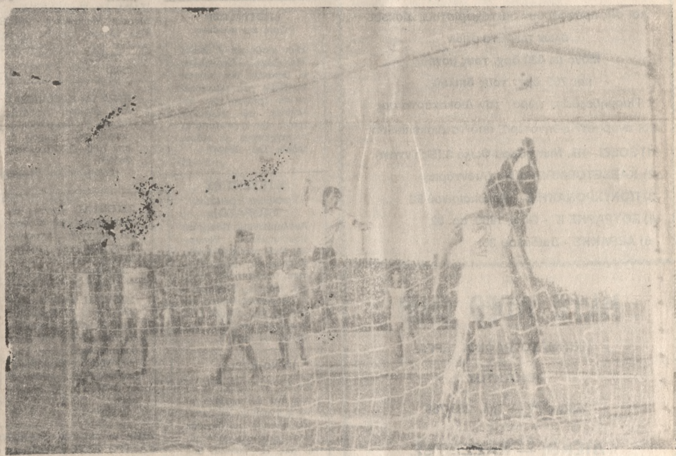
ΣΤΟ ΓΗΠΕΔΟ ΤΗΣ ΑΛΙΚΑΡΝΑΣΣΟΥ

ΟΙ ταυτότητες των μικρών αθλητών θα παραδίδονται από την Δευτέρα 30 του Απριλίου από το γραφείο 11 του Δημοσφαιρίου, κάθε μέρα από τις 9 π.μ. έως τις 2 μ.μ., έτσι ώστε να αρχίσει το πρόγραμμα «Αθλητισμός και Παιδιά» από την επόμενη Δευτέρα 7 του Μάη. Τα παραπάνω ανακοινώθηκαν από τον Δήμο Ηρακλείου.