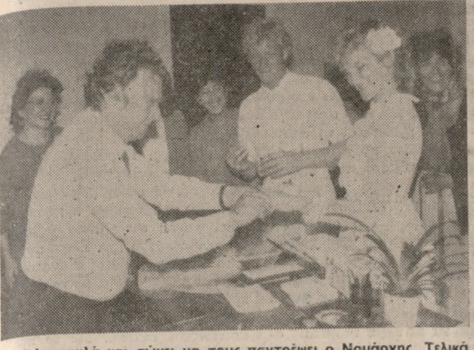
Ήθελαν καλά και σώνει να τους παντρεύει ο Νομάρχης. Τελικά τους αρραβώνισσε. Δύο παράξενα χελιδόνια από την μακρινή Σουηδία, που φέραν για λίγο την άνοιξη του βράδυ της Παρασκευής στη Νομαρχία Ηρακλείου.