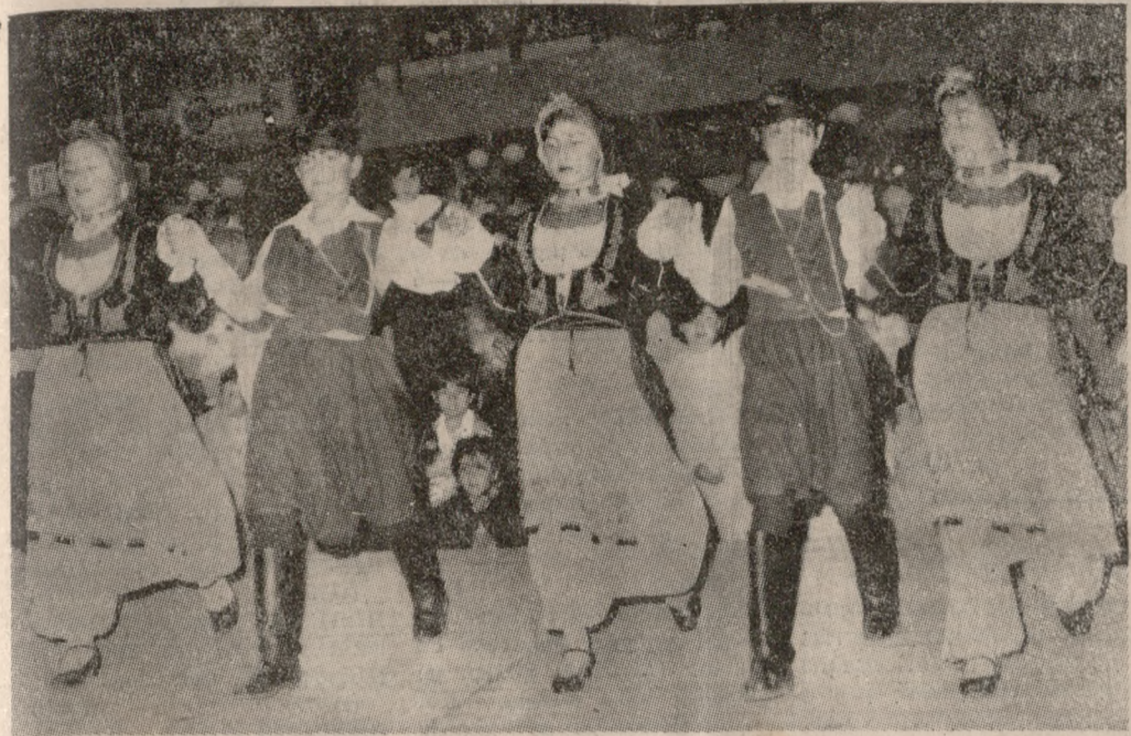
Η Ημέρα της Μητέρας γιορτάστηκε και στο Ηράκλειο. Από τις εκδηλώσεις που έγιναν ένα στιγμιότυπο.