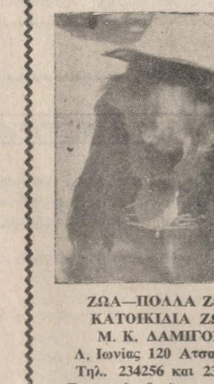
ΖΩΑ-ΠΟΛΛΑ ΖΩΑ ΚΑΤΟΙΚΙΑ ΖΩΑ Μ. Κ. ΔΑΜΙΓΟΣ

Α. Ιωνίας 120 Ατσάλειο Τηλ. 234256 και 234279 Σε μας θα βρείτε: Σκυλιά ράτσας, Ντόμιερμαν Κ9 κανελί και μαύρα, Κινγηόσκυλα μαθημένα και κουτάβια - Λυκόσκυλα - Κόλε' - Κόκερ κανελί - Κανίς - Πεκινό - Γατάκια Σιάμ, Σκυλόσκυλα λυόμενα, Μεγάλη ποικιλία αεσούαρ.