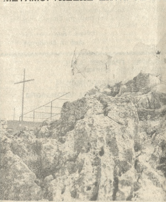
Την προσεχή Δευτέρα 6 Αυγούστου 1984 εορτάζει ο εις ΓΙΟΥΧΤΑ φερώνυμος Ιερός Ναός