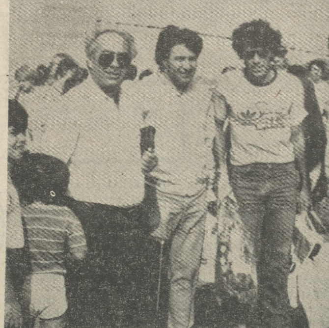
Φωτογραφία από την επιστροφή του ΟΦΗ από τη Γερμανία στο Αεροδρόμιο Ηρακλείου.

ΠΡΟΠΟΝΗΣΗ έχουν οι παίκτες της Μικτής Ηρακλειώτικης τουρνουά στις 5.30 το απόγευμα στο γήπεδο του Ηρακλείου. Για τον λόγο αυτό έχουν κλειστεί οι παρακείμενοι δημοφιλείς Μαιρώνες, Γρεβενάκης, Φουδαρίδης (ΟΦΗ), Σηραδάκης, Βαβουλάκης Σ., Μαββαίου (ΠΟΑ), Τσαγκαράκης (Ποσειδώνιος), Απιδάκης (Αλμυράς), Αντωνίου (ΕΓΟΗ), Νικηφόρος (Μινωική), Μπελιβάκης (ΠΑΝΟΜ), Χρονιάκης (Πρωτόνια), Καρανιώτης (Το Μπαλί), Γενεζάκης (Πούτσος) Γιαννούλης (Ρομανός), Παπαδόκης (Δαμιάς).