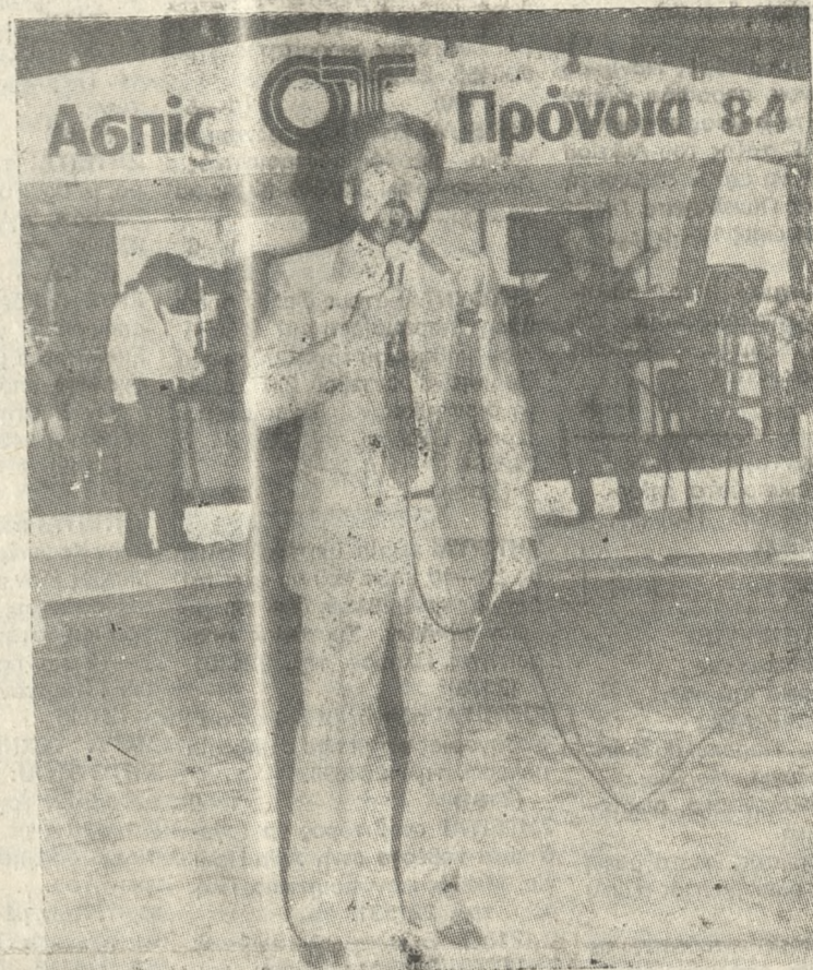
«...Δύο είναι τα πιστεύω μας. Το ήθος, και επαγγελματισμός των ασφαλιστών μας, και ο σεβασμός προς τους πελάτες μας...»