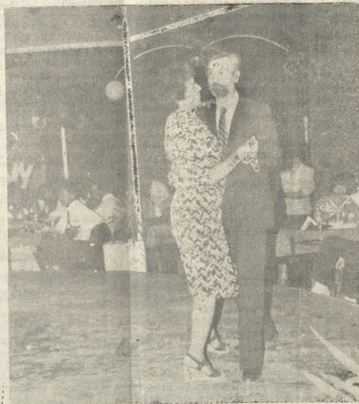
Ο κ. και η κα Καστρινάκη ανοίγοντας τον χορό.