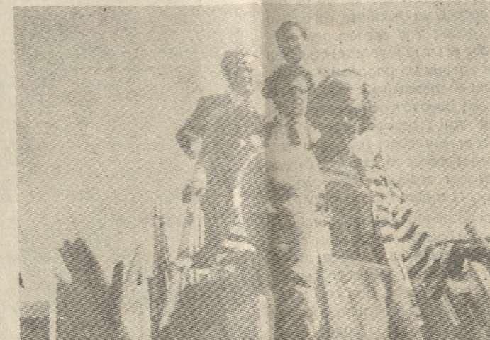
Ο κ. Παπανδρέου κατά την άφιξη του στο Ηράκλειο. Πίσω του η σύζυγός του Μαργαρίτα, η γραμματίς του κ. Κοκκόλα, και ο Διευθυντής του Πολιτικού Γραφείου κ. Λιβάνης.

Από το Υπουργείο Εθνικής Αμύνης καλούνται να παρουσιάσουν στην Πέμπτη 13 του μήνα στις 8 το πρωί όλοι οι επιτυχόντες κατά τις Γενικές Εξετάσεις 1984-85 στην στρατιωτική Σχολή Αξιωματικών Σωμάτων (ΣΣΑΣ) που εδρεύει στην Θεσσαλονίκη. Την Δευτέρα εξέλιξαν 17 του μήνα στις 8 το πρωί καλούνται να παρουσιαστούν όλες οι επιτυχόντες στη Σχολή Αξιωματικών Αδελφών Νοσοκόμων (ΣΑΑΝ) που εδρεύει στην Αθήνα. Όπως διακρίνεται σε σχετική ανακοίνωση του Υπουργείου οι επιτυχόντες πρέπει να φέρουν μαζί τους τον πρωτότυπο τίτλο απολυτήσεως του Σχολείου, πλήρες αντίγραφο Πρωτοκόπου Μητρώου τύπου «Α» πιστοποιητικό Εισαγγελικής Αρχής του τόπου καταγωγής, πιστοποιητικό Στρατιολογικού Γραφείου τύπου «Α», και πιστοποιητικό Δημόσιας ή Κινητοτικής Αρχής.