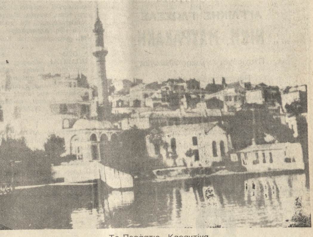
Το Προάστιο Καραντίνια.

Κατεβήκαμε λοιπόν στον κάμ- πο και αρχίζει το πυροβολικό, μας να κτυπά απέναντι. Είχαμε