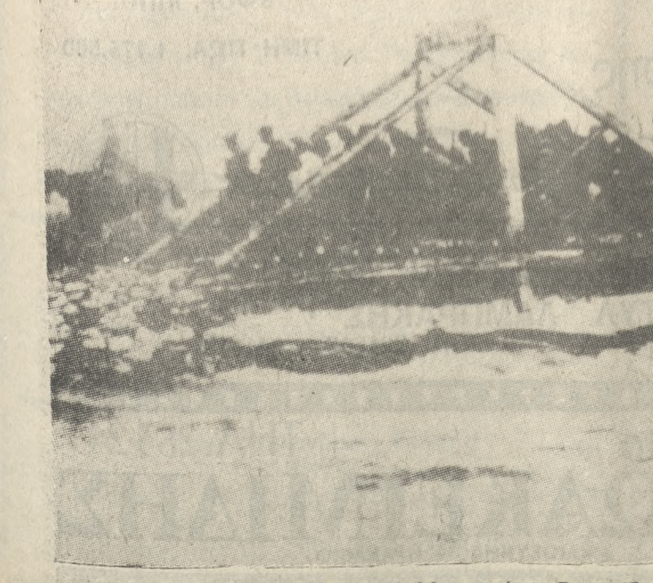
Το Πεζικό της XI Μερραρχίας, διασχίζει το Σαγγάριο.

Με πήρανε και μένα από τα έμ- πεδα τής Φιλαδέφειας και με στείλανε στο 7ο Σύνταγμα τής Δεύτερης Μερραρχίας. Διοικητή, Συνταγματάρχη, είχαμε ένα πα- λαιοέχο στρατιώτη το Ζωητό- πολου, ένα παλικάρι μέχρι εκεί που δεν έβαινε, εφάμιλλος του Νικολάου Πλαστήρα. Τέτοιο πα- λικάρι ήτανε. Του ρίσανε όμως τις