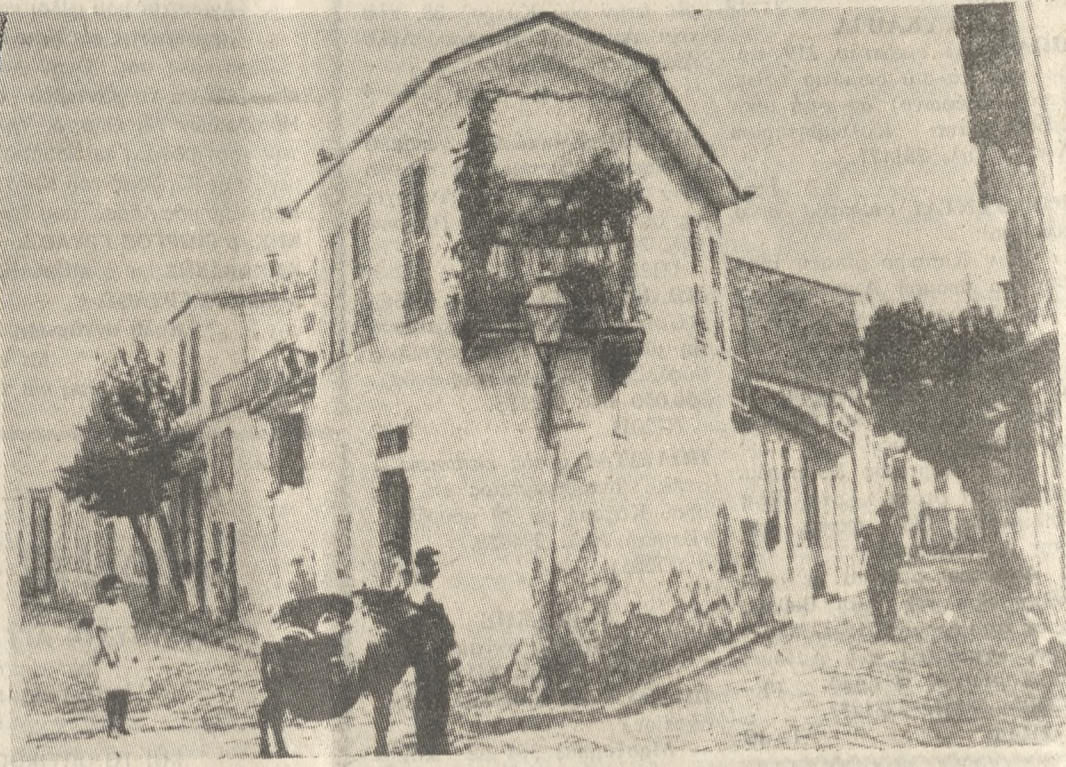
Το γραφικό «Ντουρσεκι». Τοπική αρχιτεκτονική λύση του γω- νιακού οπίθιου.

Σε ένα ύψωμα θέλαμε να βά- λουμε πυροβόλα αλλά δεν μπο- ρούσαμε γιατί δεν είχε δρόμο να πάει πάνω, ήτανε λοιπόν εκεί ένα τάγμα Μηχανικού και άνοιξε δρό- μο. Αυτό το τάγμα πήρε όλο το βάρος τής επίθεσης αλλά ήτανε οι φουκαριάρηδες όλοι τους με γκράδες για ντουφέκια, μια και ή- τανε τάγμα Μηχανικού. Στο Ε- σκί - Σεχίρ στη μέση είχανε ένα ποτάμι και όλοι είμαστε εκεί άλ- λος με μια γκαζοντενέκα άλλος με χύτρα άλλος με κουβάδες και βράζαμε νερό για να κάψουμε τις ψείρες γιατί ο κάθε στρατιώτης είχε πάνω του μια οκιά ψείρα. Ε, προλάβανε και ντυθήκαμε. Ντύ- θηκα, άρπαξα τις πολάσκες μου και το τουφέκι μου, τα νερά τρέ- χανε πάνω μου, με βρέμενα ρού- χα. Η επίθεση ήτανε πολύ αιφνι- διαστική. Όμως τους αντιμετώ- πισαμε με επιτυχία. Εκεί στο Ε- σκί - Σεχίρ σταμάτησαμε μέχρι τον Αυγουστο του 1922.