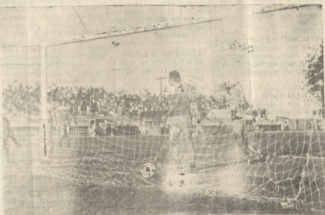
Το πρώτο γκολ του Ηρόδοτου από τον Αποστολάκη.

ΑΣ περάσουμε όμως στις λεπτομέρειες του παιχνιδιού όπου ο Ηρόδοτος έπαιξε καλό ποδόσφαιρο και εκτός από τα δυο