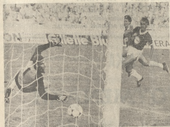
Ο Σεραφίμος, παρά την πίεση του Σαμαρά και την προσπάθεια του Χασάδα, στέλνει τη μπάλλα στα δίχτυα του Ο.Φ.Η.

ΟΙ ΕΠΙΘΕΣΕΙΣ του Παναθηναϊκού ήταν σφοδρές, αλλά η ομάδα του Ηρακλείου οχυρώθηκε πίσω από γρανιτένιο τείχος, που όμως τελικά δεν άντεξε. Άρχισε να ραγίζει και από δύο ρήγματα ο Παναθηναϊκός κατάφερε να παραβιάσει ισάριθμες φορές την εστία του Ο.Φ.Η. Έτσι στην προεπιλογή του δού Επαγγελματικού Πρωταθλήματος Α' Εθνικής Κατηγορίας, ο Παναθηναϊκός κέρδισε τον ΟΦΗ με 2-0, μέσα στο Ιερό του Ελληνικού Αθλητισμού, στο Ολυμπιακό Στάδιο. Κακή αρχή θα πουν μερικοί, φυσιολογική θα την χαρακτηρίσουν άλλοι και το θέμα θα ξεχαστεί. Η ουσία είναι ότι ο ΟΦΗ, πραγματοποιώντας ικανοποιητική εμφάνιση, μπορούσε να αποσπάσει ένα καλύτερο αποτέλεσμα — ισοπαλία ως πούμε — μπροστά όμως να είχε δεχθεί κι άλλα γκολ, αφού οι γηπεδούχοι έχασαν πέναλτυ, έστω κι αν κακώς δόθηκε, και είχαν 3 δοκάρια. Το πώς και το γιατί, θα το δούμε παρακάτω στην περιγραφή του αγώνα.