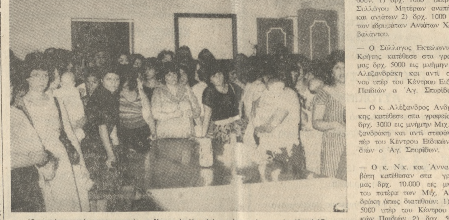
Όπως είχαμε γράψει προ ημερών, η Νομαρχία Ηρακλείου ανέκρινε ένα ποσό 40 χιλιάδων δραχμών στις εργαζόμενες και μη ασφαλισμένες μητέρες. Χθες έγινε η χορήγηση αυτών των ποσών στη Νομαρχία, απ' όπου είναι και το σημείο τήσης φωτογραφίας μας.