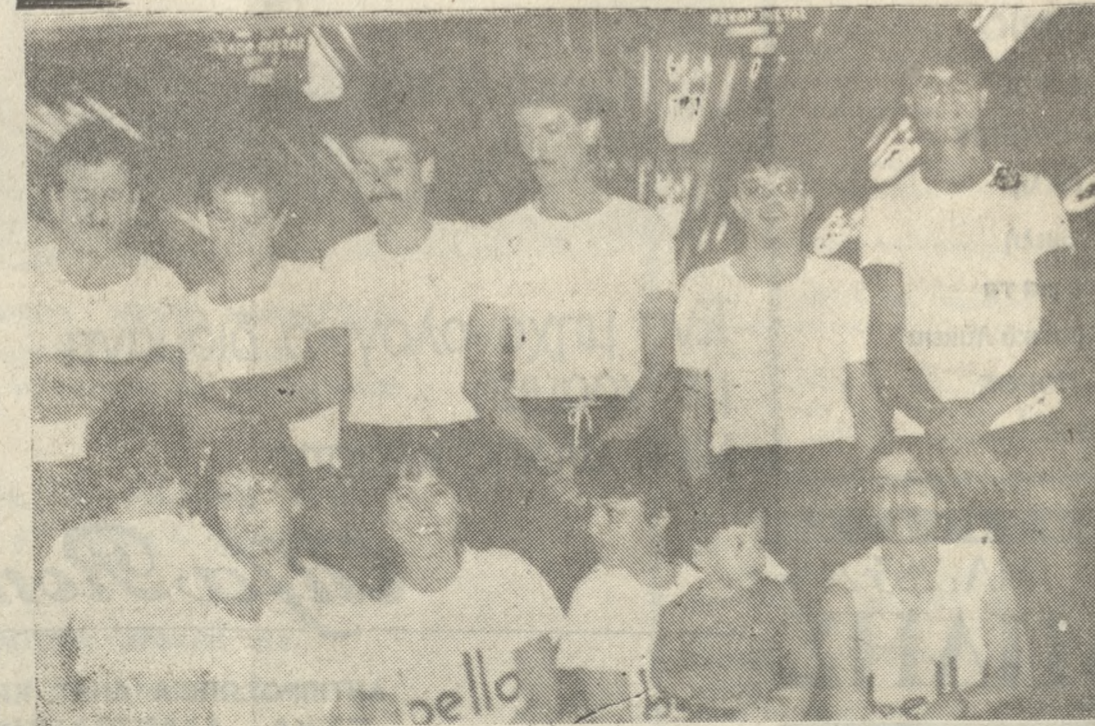
Η ομάδα του CANDIA Μπούλιγκ, που πήρε τη δεύτερη θέση.