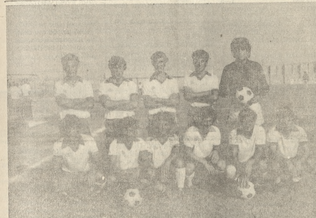
Ο Ηρόδοτος, ο οποίος δεν ικανοποίησε χθες τους οπαδούς του, όχι μόνο γιατί παραχώρησε ισοπαλία, αλλά και γιατί δεν έκανε καλή εμφάνιση.