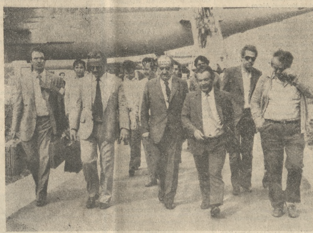
Ο υπουργός Έργασίας κ. Ευάγγελος Γιαννόπουλος κατά την άφιξη του στο Ηράκλειο.

Οι παραγωγικές δυνάμεις, οι παραγωγικές σχέσεις γενικά α από την αγροδοτική πλευρά ήσαν προγραμματισμένη. Αν συμμετείνα να ακολουθεί ο κ. Μητροπολίτης, νόρμαζε δήλα δη ένδοξο και καταϊθρομένο είναι σίμπτωμα. Εκτός και αν το ήξερε πως θα κατέβει και το οργανώσει...»