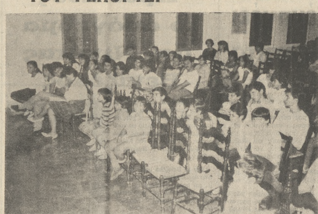
Ένα στιγμιότυπο από την έναρξη των συζητήσεων των Χριστιανικών Μαθητικών Ομάδων (Χ.Μ.Ο.) στην αίθουσα του Αγ. Ιωάννη του Ελεφήμονα.