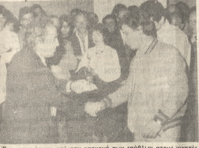
Ένα στιγμιότυπο από την απονομή των επάλθων στους νικητές του Ράλλυ - Κρήτης.

Έγινε τήν Κυριακή το πρώτο του 6ο Ράλλυ Κρήτης, το οποίο διοργάνωσε ο ΑΟΚ με συμμετοχή 18 πληρωμάτων από τα οποία τερμάτισαν 15. Συγκεκριμένα εγκατέλειψαν οι SCRUTZ (μωτέρ), Κακιάκης και Ανταλουδάκης (βγάλσιμο). Πρέπει να σημειωθεί ότι λόγω των δυσμενών καιρικών συνθηκών που επικράτησαν Πέμπτη και Παρασκευή δεν μπόρεσαν να λάβουν τα περισσότερα αθηναϊκά πληρωμάτα που είχαν δηλώσει συμμετοχή. Η απόφαση των επάλθων στους νικητές έγινε το βράδυ στο ξενοδοχείο «GALAXY».