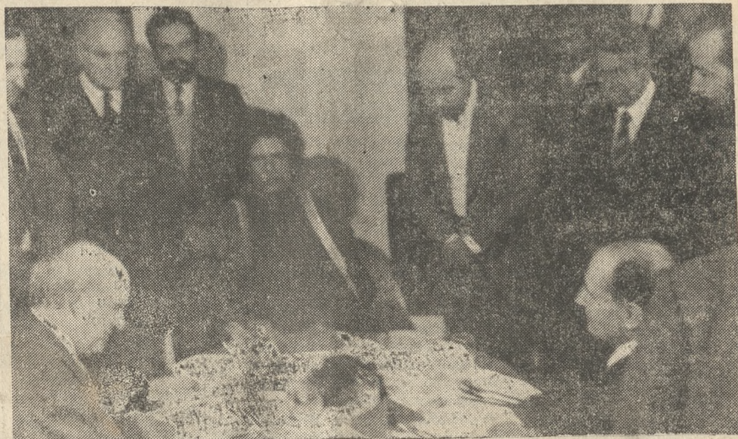
Παπανδρέου - Καντάφι - Μιττεράν σε στρογγυλό τραπέζι. Έχει σπάσει ο πάγος. Η ένταση ανάμεσα στις δύο χώρες, ανήκει πια στην ιστορία.