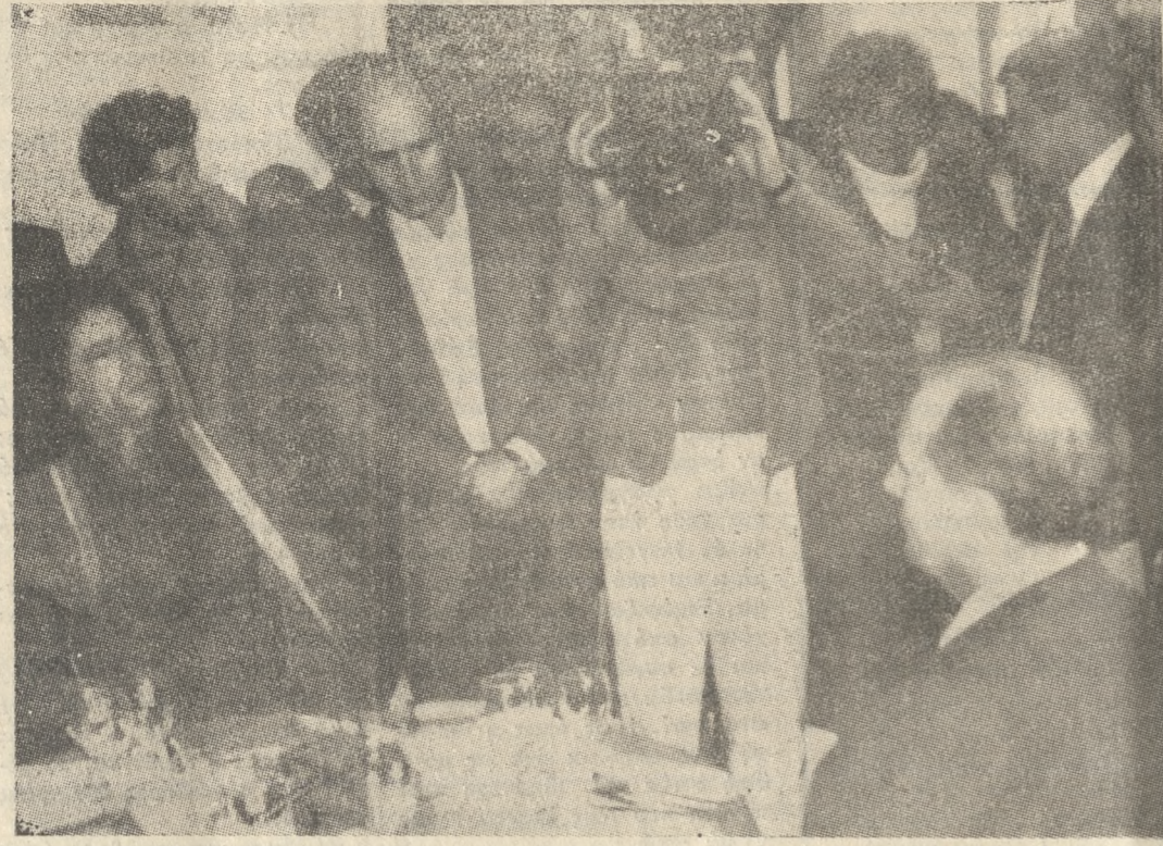
Η κορύφωση της επιτυχίας του κ. Παπανδρέου, Μιττεράν και Καντάφι συζητούν, γράφοντας μία νέα σελίδα στην ιστορία της Μεσογείου.