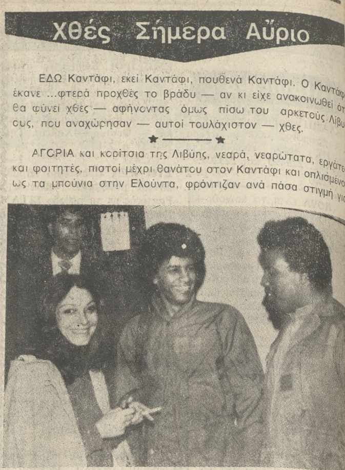
ΕΔΩ Καντάφι, εκεί Καντάφι, πουθενά Καντάφι. Ο Καντάφι έκανε... φημίτες προχθές το βράδυ — αν κι είχε ανακουφιστεί από τα φημίτες — αφήνοντας όμως πίσω του αρκετούς Λίβανους, που αναχώρησαν — αυτοί τουλάχιστον — χθές.