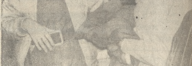
Όχι, όχι, δεν συζητούν για την συνάντηση κορυφής. Για εκλογές συζητούν. Εκλογές για την Προεδρία της Δημοκρατίας, εκλογές για το Κοινοβούλιο... Αποτέλεσμα; Κανένα. Και οι μεν και οι δε αποδεικνύονται καλοί μονομάχοι...