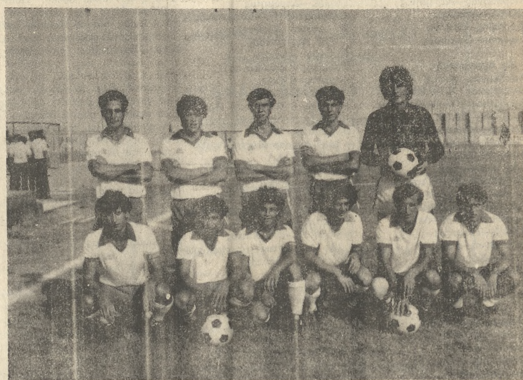
ΓΙΑ ΤΟ ΠΡΩΤΑΘΛΗΜΑ Γ' ΕΘΝΙΚΗΣ

Εμείς το Διοικητικό Συμβούλιο της ΕΠΕΗ που εκπροσωπούμε τους αθλητικούς σπόγγους της Ένωσης μας από φασίστες ελπίσματα να τηρηθεί ΣΠΗ ΕΝΟΣ ΛΕΙΠΟΥ στους σημερινούς αγώνες ποδοσφαίρου, σαν ελάχιστος φόρος τιμής στους ήρωες του Πολυτεχνείου. Και καλούμε όλα τα μέλη της Ένωσης να πάρουν μέρος σ' όλες τις εκδηλώσεις για την επέτειο που οργανώνονται σ' ολοκλήρωτο του ματς. Το Δ.Σ.ΕΠΕΗ